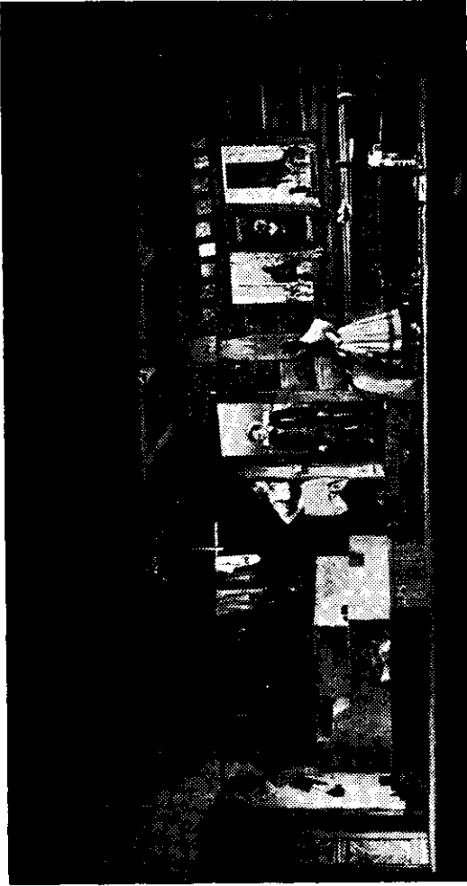
J. K. Tyl: Tvrdohlavá žena aneb zamilovaný školní mládenec – Národní divadlo, Praha – 1952 – režie: laureát státní ceny J. Průcha, výprava: J. Svoboda

Nechť ještě dlouho, v plném zdraví a svě-