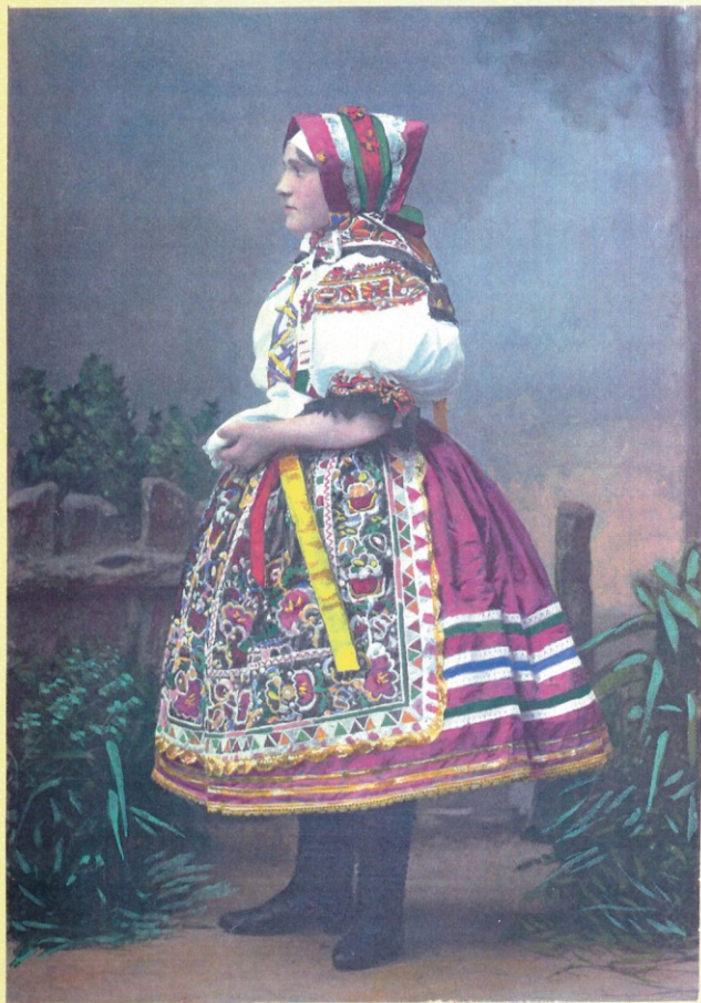
Chorvatiské děvče z Nového Přerova. Kroatisches Mädchen aus Neu-Preraw.