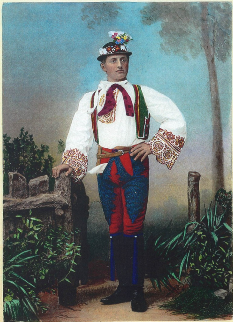
Chorvatský junák z Nového Přerova. Kroatischer Bursch aus Neu-Preraw.