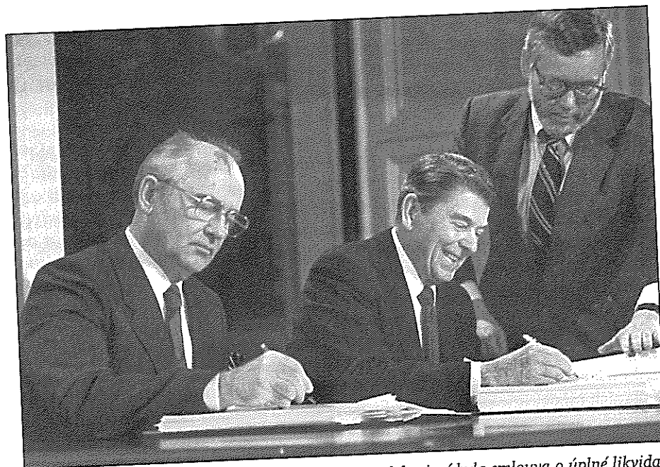
Jedním z klíčových průlomů v procesu jaderného odzbrojení byla smlouva o úplné likvidaci jaderných raket středního doletu, kterou podepsali americký prezident Ronald Reagan a sovětský generální tajemník Michail Gorbačov 8. prosince 1987 ve Washingtonu. Poprvé v historii se velmoci dohodly na zničení celé jedné kategorie jaderných zbraní

aliance a Varšavská smlouva, měly bohaté zkušenosti s kontrolou zbrojení i s opatřeními na posílení důvěry, což se ukázalo jako důležité, jakmile v osmdesátých letech přistoupily k uvolňování napětí a později k transformaci bezpečnostního systému v Evropě.