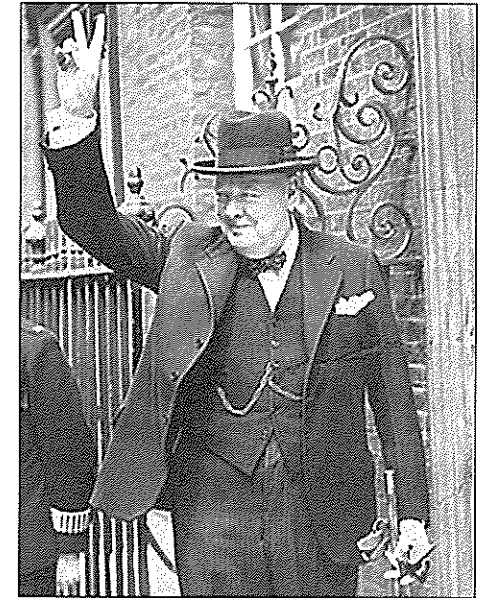
Sir Winston Churchill (1874–1965) nazval poslední díl svých válečných memoárů výstižně Triumf a tragédie . Sovětský postup na osvobozených územích ho vedl až k úvahám, zda proti Moskvě nepoužít síly. Operace dostala rovněž výstižný název: „Nemyslitelné“

Churchill spojoval s atomovou bombou velká očekávání. Jak naznačují jeho poznámky z Postupimi, spatřoval v ní potenciální odstrašující prostředek a věřil, že změni poměr sil, který se v Evropě vytvářel. Bomba však neměla v Evropě žádný bezprostřední efekt a sedm měsíců po Hirošimě, 5. března 1946, pronesl Churchill svůj proslulý projev, v němž odsoudil spuštění železné opony napříč kontinentem. S tím, jak se rozvíjela studená válka, rozdělení kontinentu se prohlubovalo. Spojené státy podpořily hospodářskou obnovu západní Evropy prostřednictvím Marshallova plánu, zatímco ve východní Evropě Sovětský svaz upevňoval své panství; zvláště přelomo-