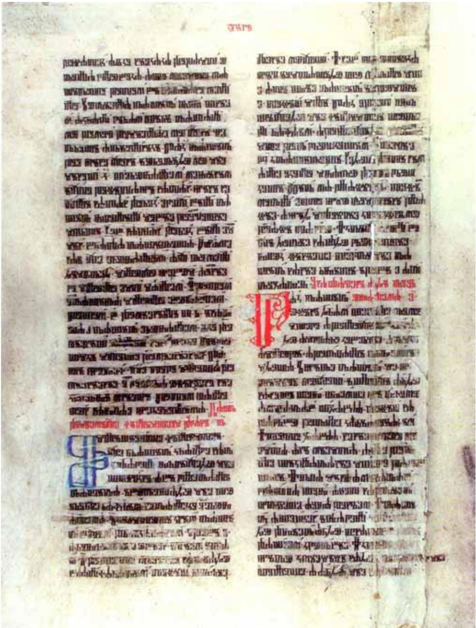
Staročeský hlaholský Comestor, zlomek Třeboňský II, 5, fol. 9b αβ Pacnerová, L.: Staročeský hlaholský Comestor. Slovanský ústav AV ČR – Nakladatelství Euroslavica, Praha 2002, s. LI.