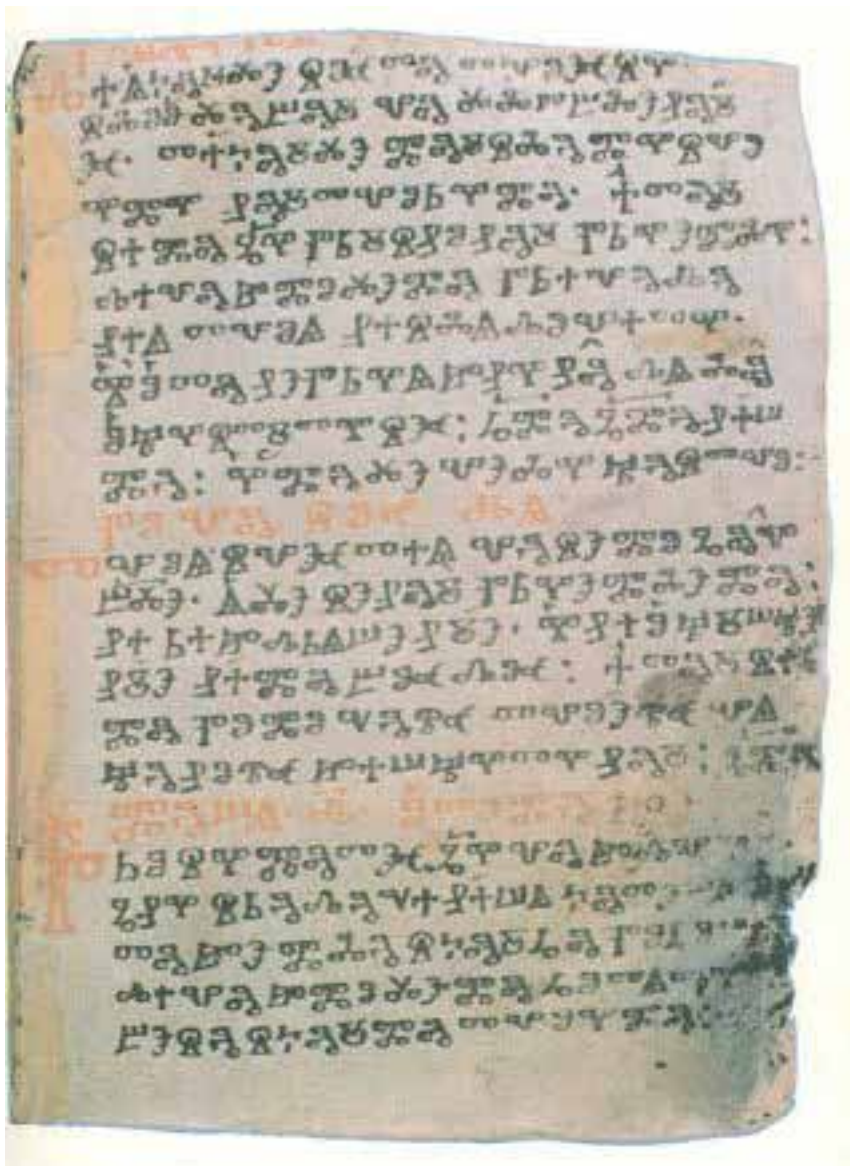
Kyjevské listy, fol. 5b

Німчук, В.В.: Київські глаголичні листки. Найдавніша пам'ятка слов'янської писемності, Наукова думка, Київ 1983.