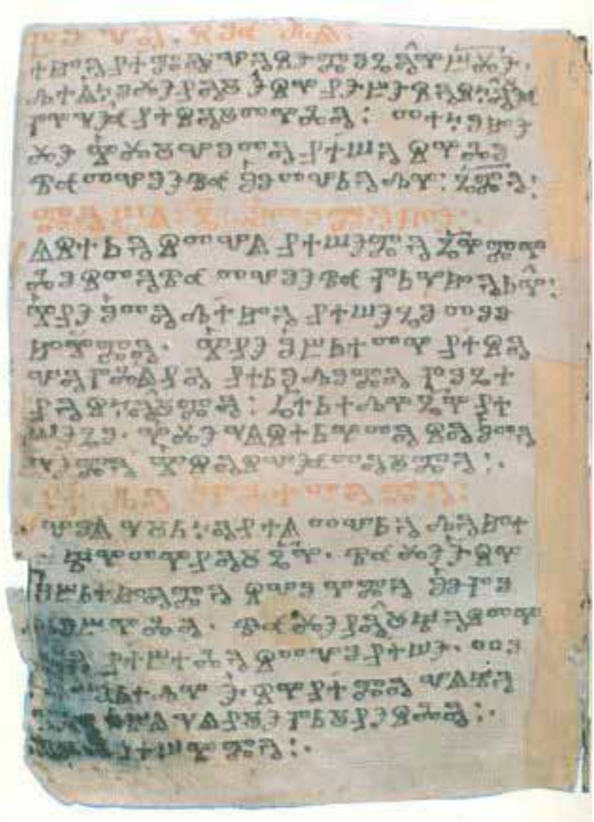
Kyjevské listy, fol. 4b

Німчук, В.В.: Київські глаголичні листки. Найдавніша пам'ятка слов'янської писемності, Наукова думка, Київ 1983.