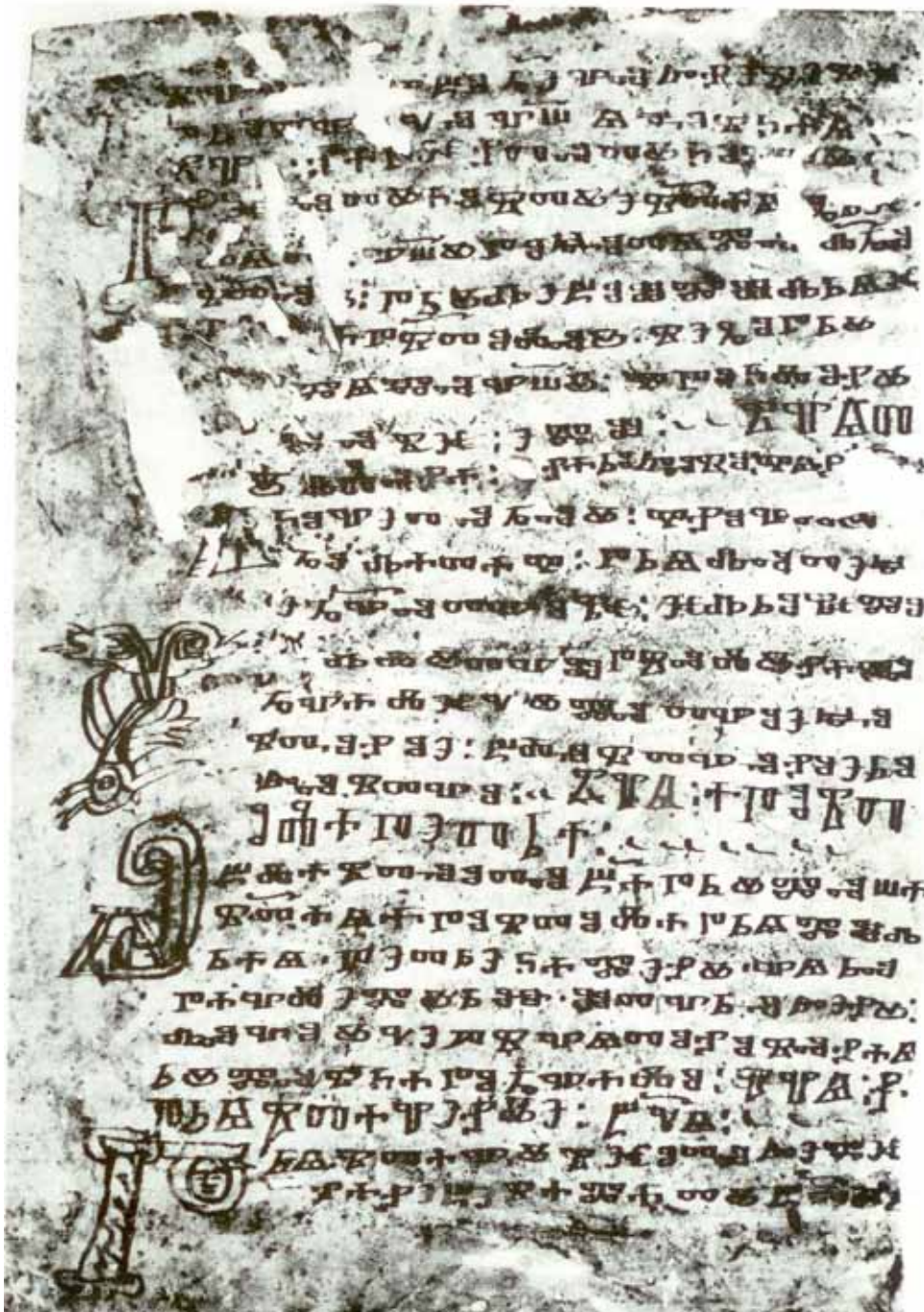
Pražské zlomky hlaholské, fol. 1b

Reichertová, K. – Bláhová, E. – Dvořáková, V. – Huňáček, V.: Sázava. Památník staroslověnské kultury v Čechách. Odeon, Praha 1988, s. 323.