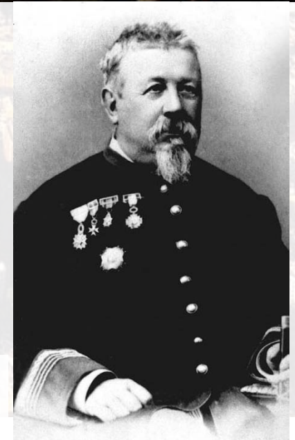
Nahoře: Ildefons Cerdà Dole: Antoni Rovira i Trias