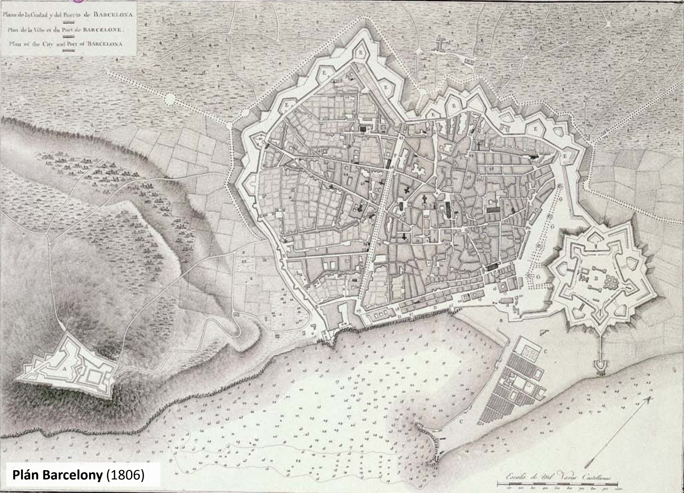
Plán Barcelony (1806)

Plano de la Ciudad y del Puerto de BARCELONA. Plan de la Ville et du Port de BARCELONE. Plan of the City and Port of BARCELONA.