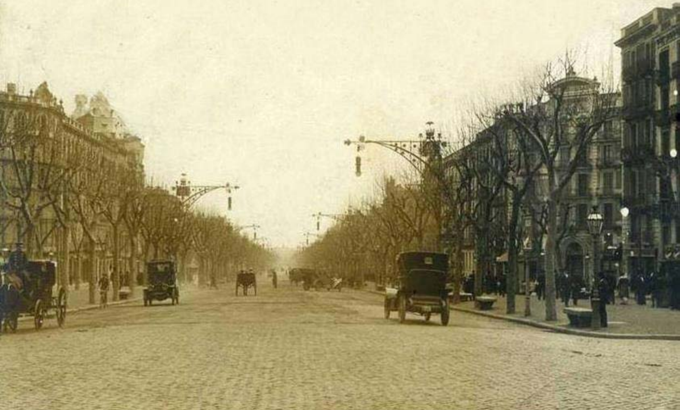
Passeig de Gràcia (1912)