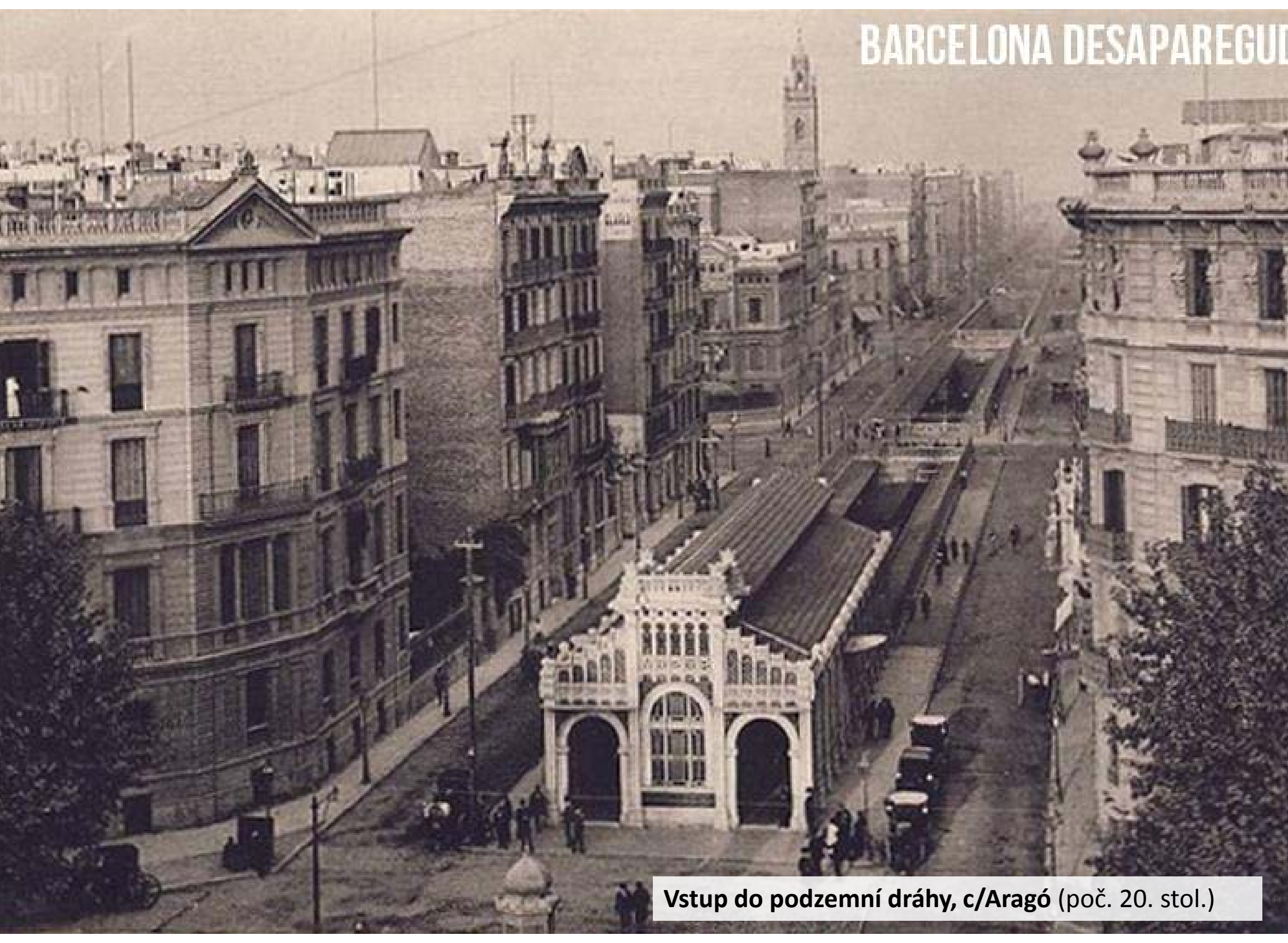
Vstup do podzemní dráhy, c/Aragó (poč. 20. stol.)