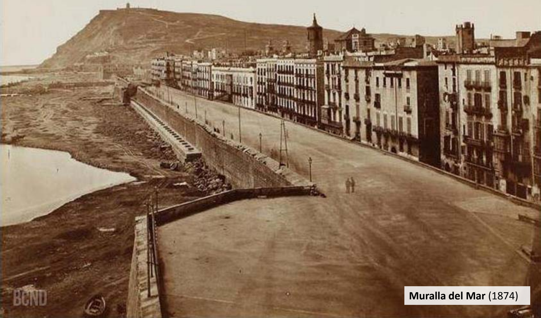
Muralla del Mar (1874)