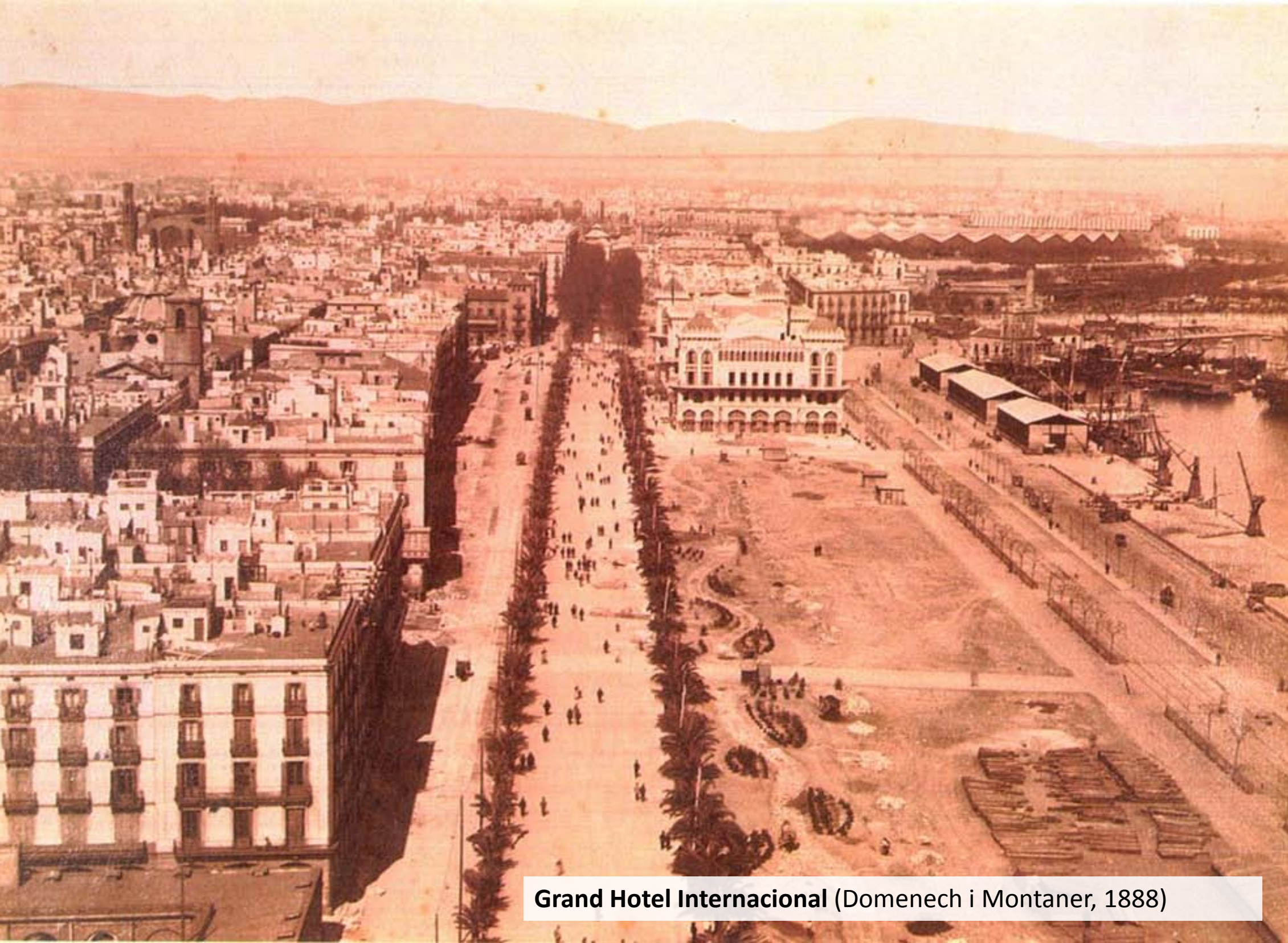
Grand Hotel Internacional (Domenech i Montaner, 1888)