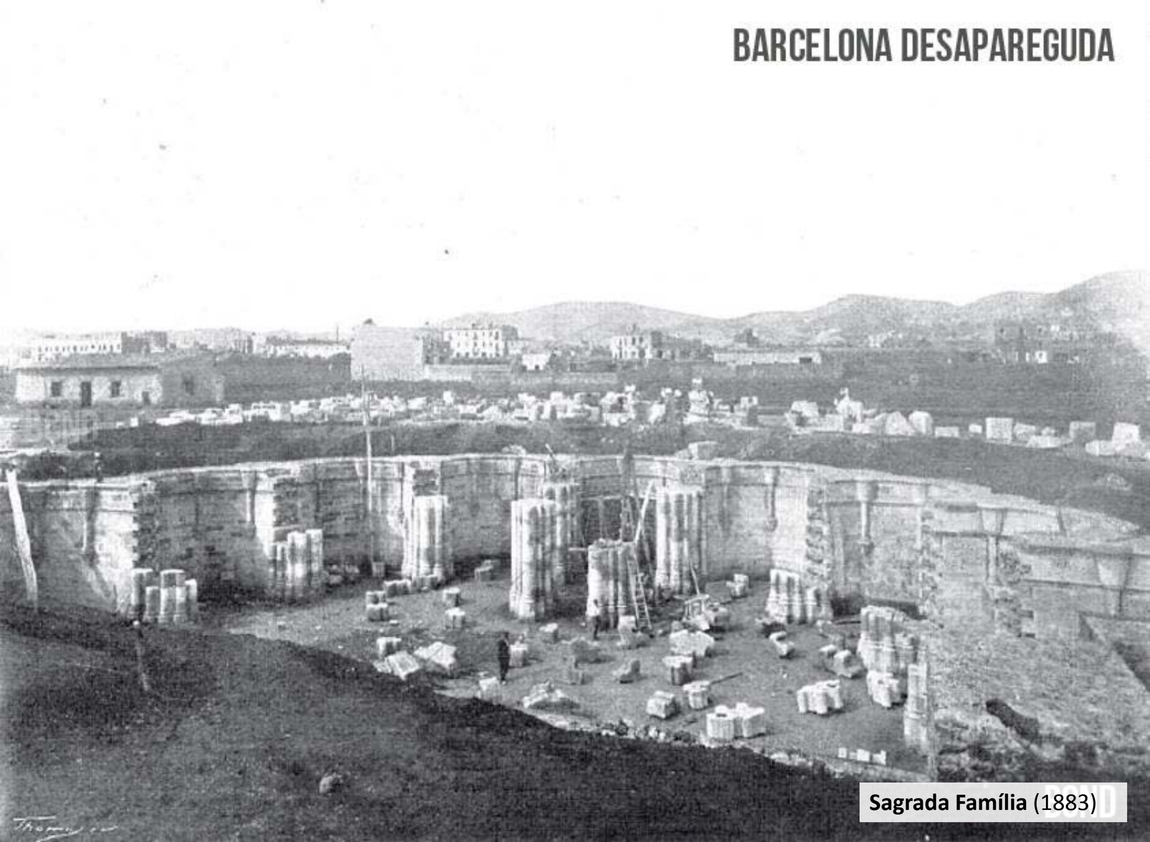
Sagrada Família (1883)