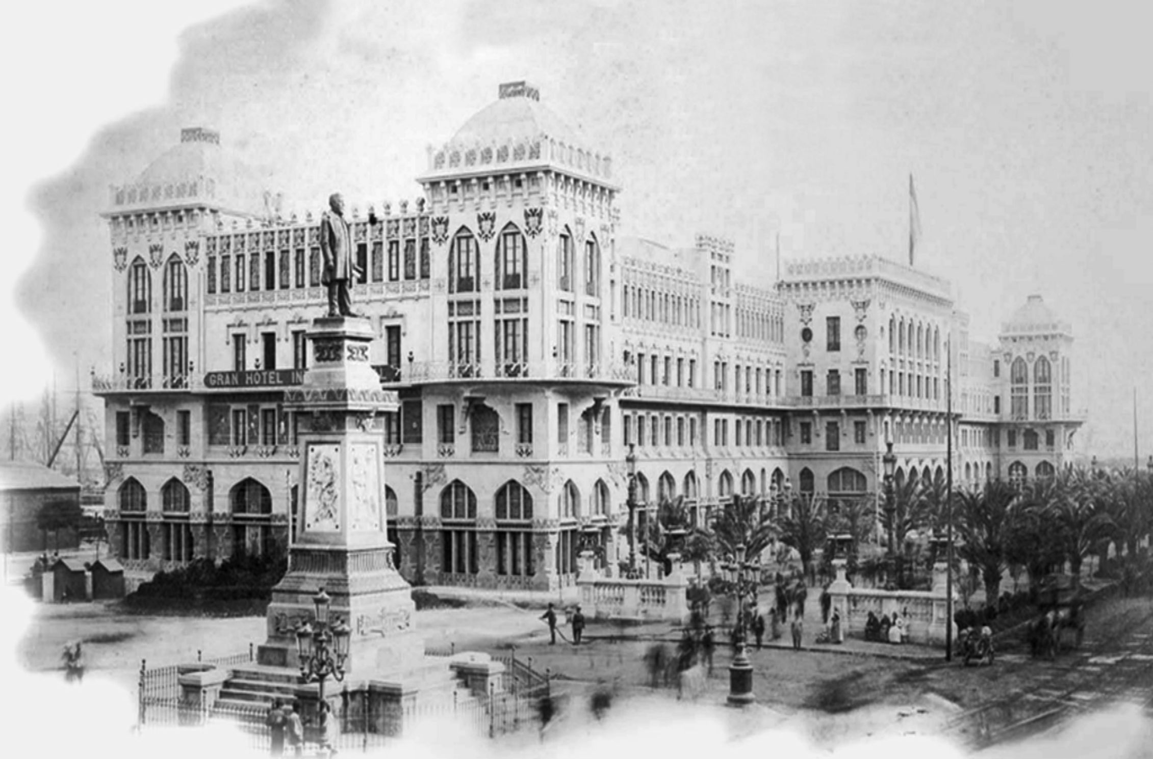
Grand Hotel Internacional (Domenech i Montaner, 1888)