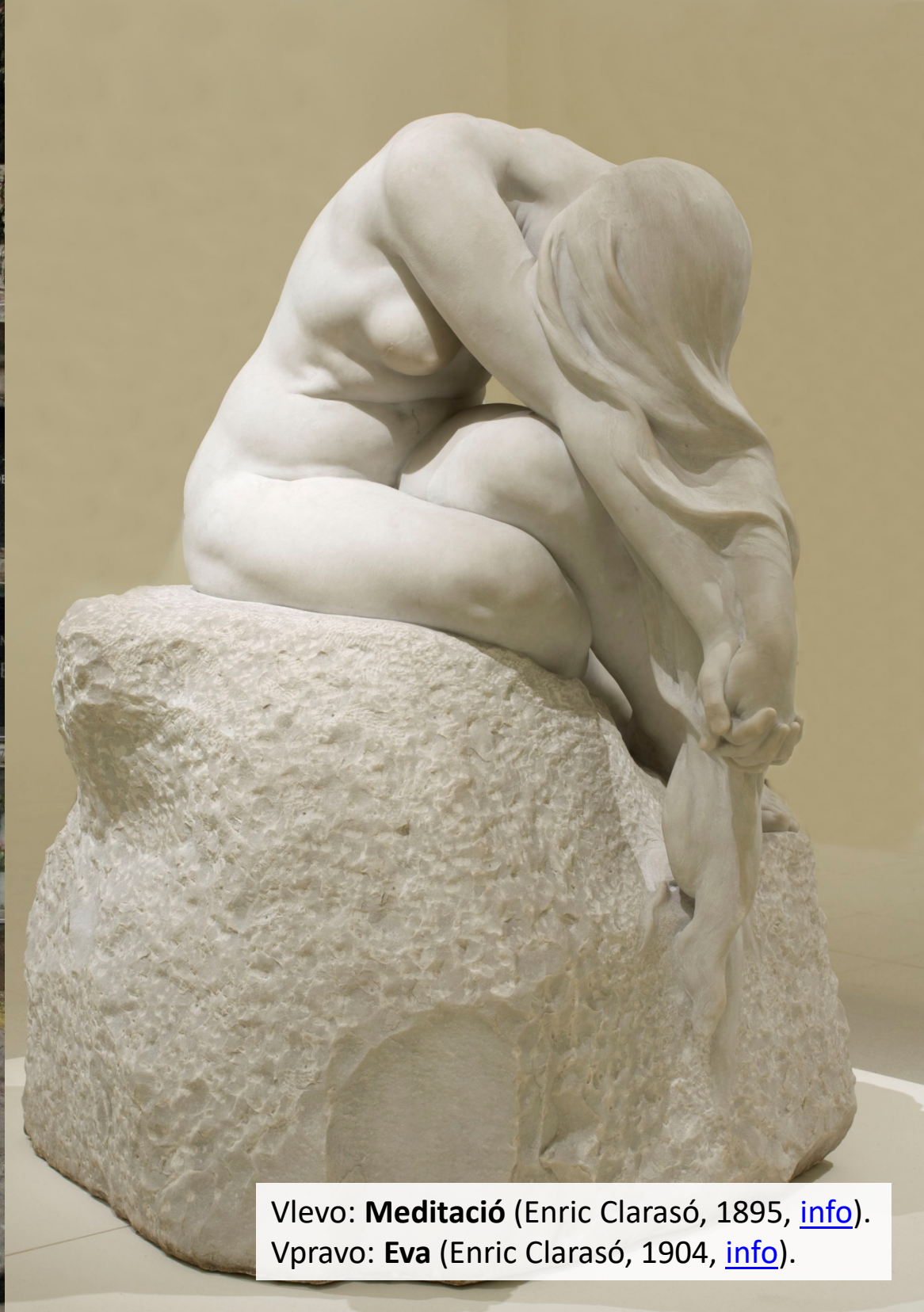
Vlevo: Meditació (Enric Clarasó, 1895, info ). Vpravo: Eva (Enric Clarasó, 1904, info ).