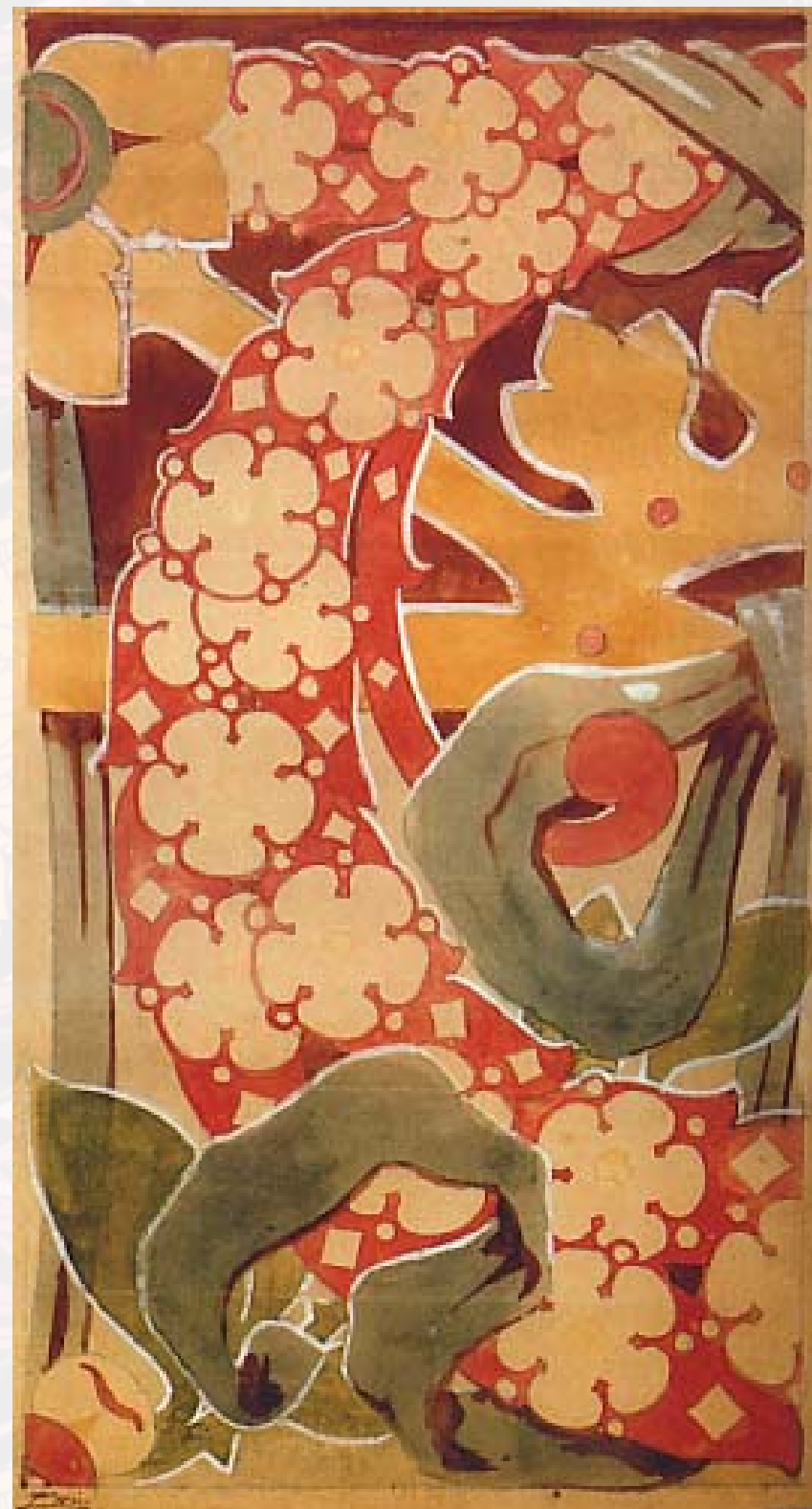
Nahoře: Casa Vicens (Gaudí)