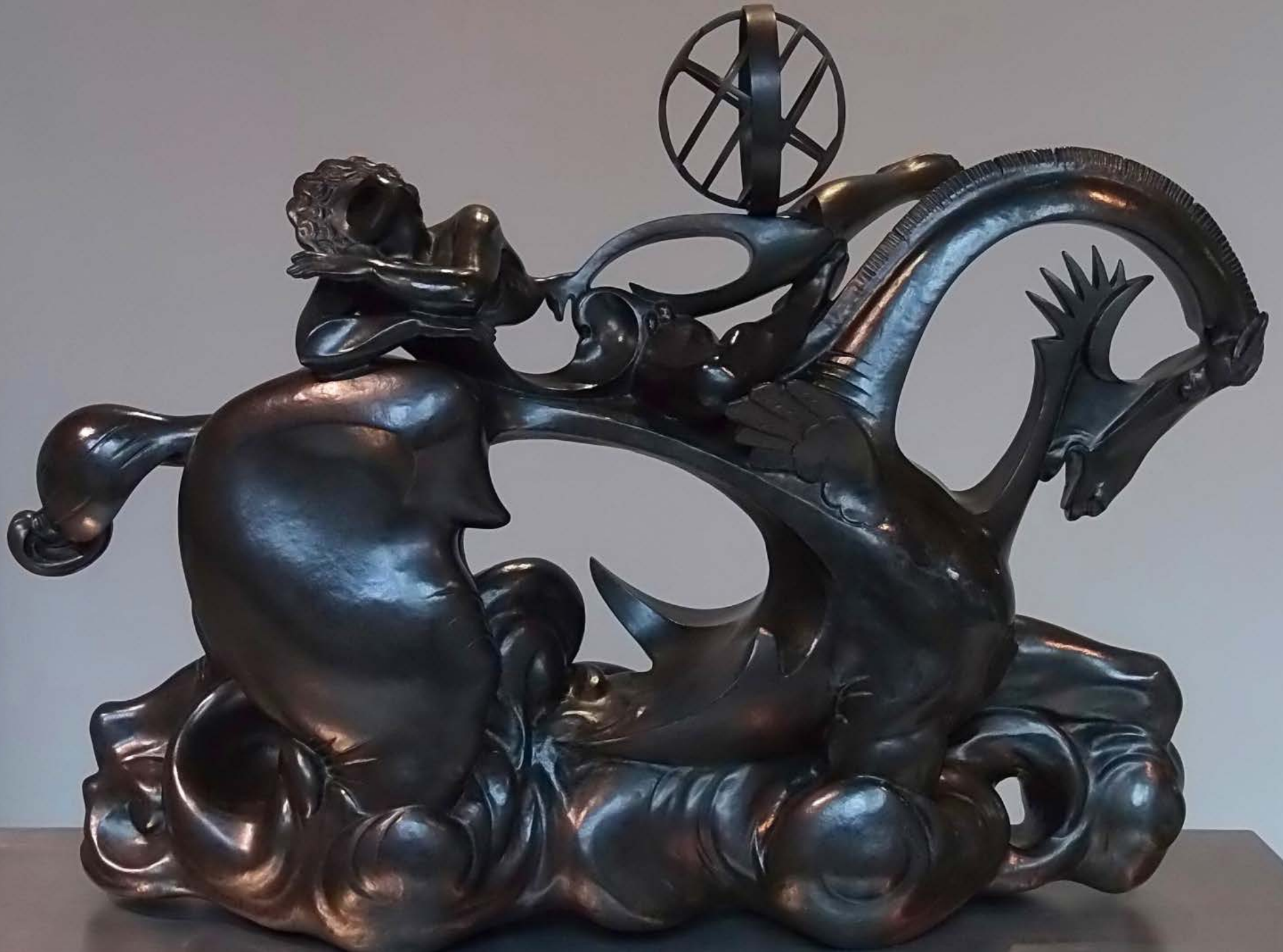
Urà (Pau Gargallo, 1933)