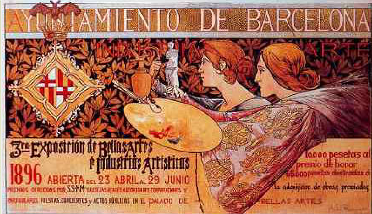
Ukázka plakátů z dílny A. de Riquera