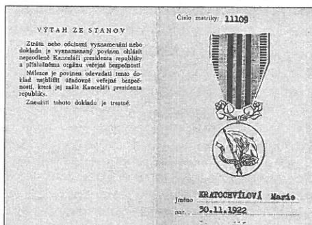
Průkaz k vyznamenání Za pracovní věrnost, 1972, soukromá sbírka

Zcela specifická situace nastala v socialistickém Československu. Vládními nařízeními č. 30 ze dne 3.4.1951 a č. 6 ze dne 8.2.1955, jimiž byly založeny nové státní řády a vyznamenání – ideově zcela souzřejmější se sovětskými vzory 27 – byly zavedeny tři typy udělovacích dokumentů: diplom , řádová knížka a průkazka . Např. k civilnímu Řádu práce či k vyznamenání Za vynikající práci patřil diplom , ovšem ve formě listiny, a legitimace , již se nositel prokazoval. V případě udělených vojenských vyznamenání jako Řád rudé hvězdy či medaile Za službu vlasti obdržel vyznamenaný pouze řádovou knížku nebo průkazku. Až s udělováním vojenských vyznamenání kolektivům (zejména městům, vojenským útvarům, jednotkám Lidových milicí apod.) byly vydávány dekrety ve formě listiny. Tomuto modelu se zcela vymykala Dukelská pamětní medaile z roku 1959, k níž byl vydán jak dekret, jenž neměl povahu listiny (pouze formu diplomu),