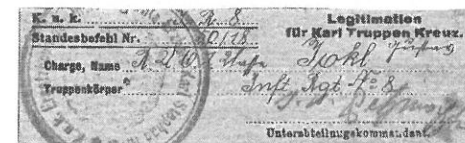
Průkaz k Železnému záslužnému kříži a Karlovu vojenskému kříži, 1917–1918, soukromá sbírka