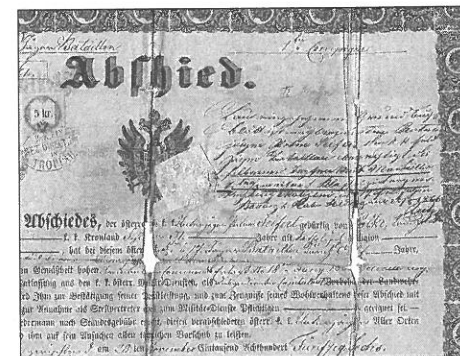
Propouštěcí list z armády se zápisem stříbrné medaile Za statečnost I. třídy, 1866, SOkA Jeseník, Sb. archiválií různého původu, kart. 17, inv. č. 325

Byla používána, jak z výše uvedeného plyne, zejména ve válečných dobách, kdy technicky nešlo zajistit tisk a předání dekretů. Např. v Sovětském svazu vydávalo prezídium Nejvyššího sovětu SSSR prozatímní potvrzení ( vremennnoje udostoverenije ) 30 a Ministerstvo národní obrany čs. exilové vlády v Londýně vydávalo legitimace k československým válečným vyznamenáním. 31 Po ukončení války je nahradily dekrety formátu A4. Byla též obnovována, resp. zakládána spolková vyznamenání čs. branných organizací, jakými byl např. Svaz Národních gard a jeho nástupce Svaz brannosti – před vytištěním dekretů postačoval i strojopis. 32