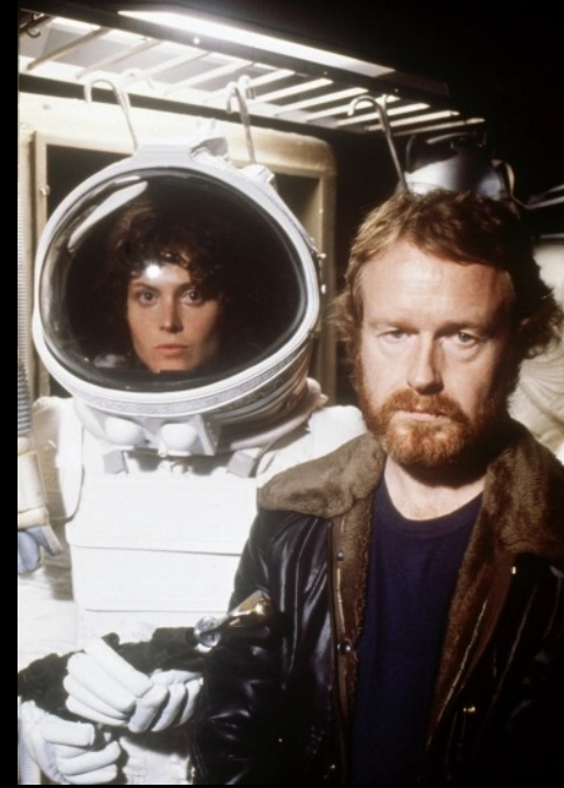
Ridley Scott: Alien 1979, Blade Runner 1982

https://www.youtube.com/watch?v=JnVyANe0ZnE&index=8&list=P LjHdPL8MePTw2oXzGlp0WTENwx A-YX2nB (pol 80.let)