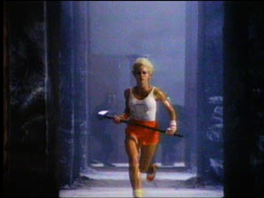
TBWA (zal. 1970 Paříž, od 1993 pod Omnicom Gr.)