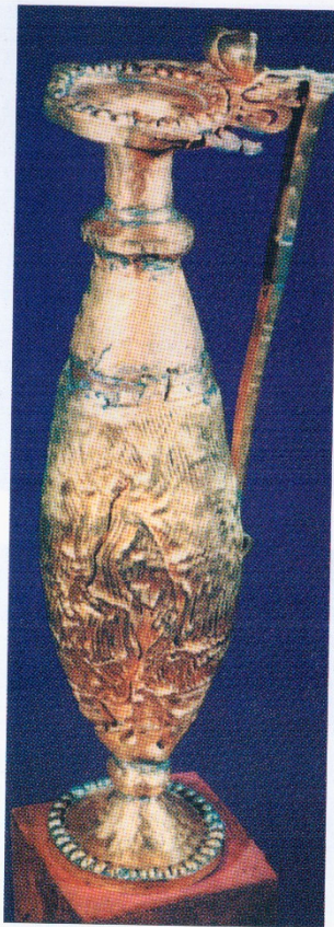
Džbán na vodu z ostrogótského pokladu, uloženého snad kolem poloviny 5. stol. (Pietroasa v Rumunsku)