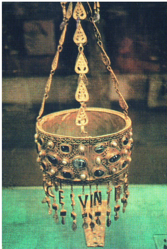
Votivní koruna krále Reccesvintha (653–672) s nápisem: Reccsvintus rex offert (Věnuje král Reccesvinth). Byla součástí pokladu z Fuente de Guarrazar u Toleda