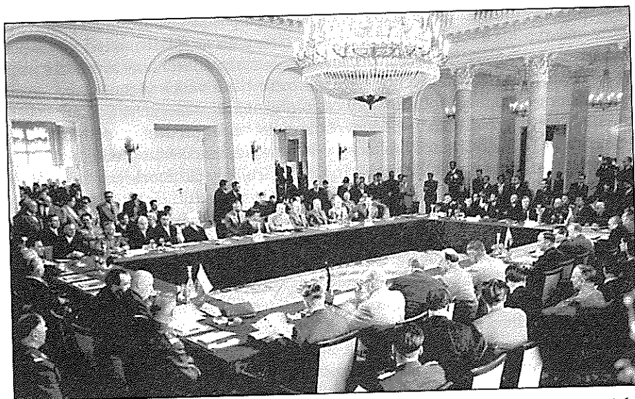
Založení Varšavské smlouvy dne 14. května 1955 ve Varšavě bylo zpočátku chápáno jako nástroj utužení sovětské kontroly nad ostatními členskými státy (Albánie, Bulharsko, Československo, Maďarsko, Německá demokratická republika, Polsko, Rumunsko). Postupně se však stala fórem umožňujícím částečnou emancipaci těchto zemí v rámci východního bloku

Zatímco v Evropě dostalo prioritu rozvíjení hospodářských styků se západoevropskými státy, ve třetím světě bylo hlavním cílem usnadňovat sovětské hospodářské a politické pronikání a následné získávání trvalého vlivu. 13