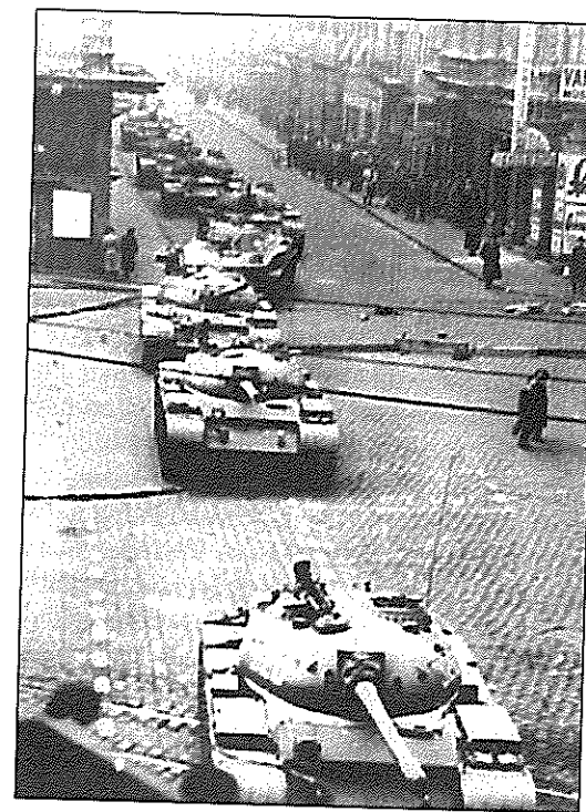
Sovětské tanky v ulicích Budapešti během lidového povstání v listopadu 1956. Sovětské vedení sáhlo k vojenské intervenci jako způsobu řešení krize, poprvé však v krizové situaci konzultovalo její řešení s představiteli dalších zemí svého mocenského bloku

slovil náměstek předsedy Rady ministrů SSSR Anastas Mikojan, uznávaný člen sovětského vedení a člověk, který rozuměl maďarské situaci nejlépe: „Bez Nagy nemohou hnutí řídit, je to pro nás také levnější. Vyjadřuje pochybnosti ohledně vyslání jednotek. Co tím ztrácíme? Maďaři si zjednájí pořádek sami. Měli bychom dát šanci politickým prostředkům, a teprve potom nasadit jednotky.“ 19 Strategie řešení závažných krizí v jednom z členských států sovětského bloku v podobě, jak ji prezentoval Mikojan, tedy obnovení pořádku místními silami a bez nasazení sovětské armády (lze zde zcela jistě hovořit o Mikojanově doktríně), 20 byla v dané situaci jedinou racionální alternativou. Ostatní členové předsednictva však neustoupili a hlasovali pro sovětskou intervenci. Sovětské vedení, které od roku 1953 řešilo problémy světové politiky pragmaticky a i při hledání řešení polské krize na poslední chvíli odolalo z ideologických a citových důvodů imperiálnímu reflexu uchýlit se k ozbrojené intervenci, nedokázalo v maďarském případě vyčkat a ovládnout se. Chruščov a jeho spolupracovníci tak učinili i z vlastního úhlu pohledu nejhorší možné politické rozhodnutí a nastartovali proces, jehož dopady přinesly právě to, čeho je ozbrojená intervence měla ušetřit. Jinými slovy, docílili přesného opaku toho, čeho chtěli dosáhnout – nikoli rychlé pacifikace, ale přeměny ojed-