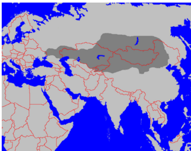
Trasa pravděpodobného stěhování Hunů