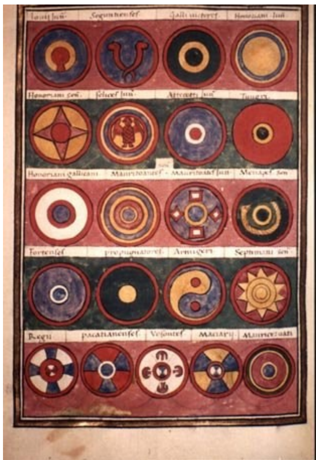
Notitia dignitatum, západořímská část (ve 2. řadě zdola jde o třetí znak zleva).