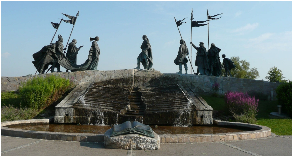
Památník setkání Attily s Kriemhildou v Dolním Rakousku