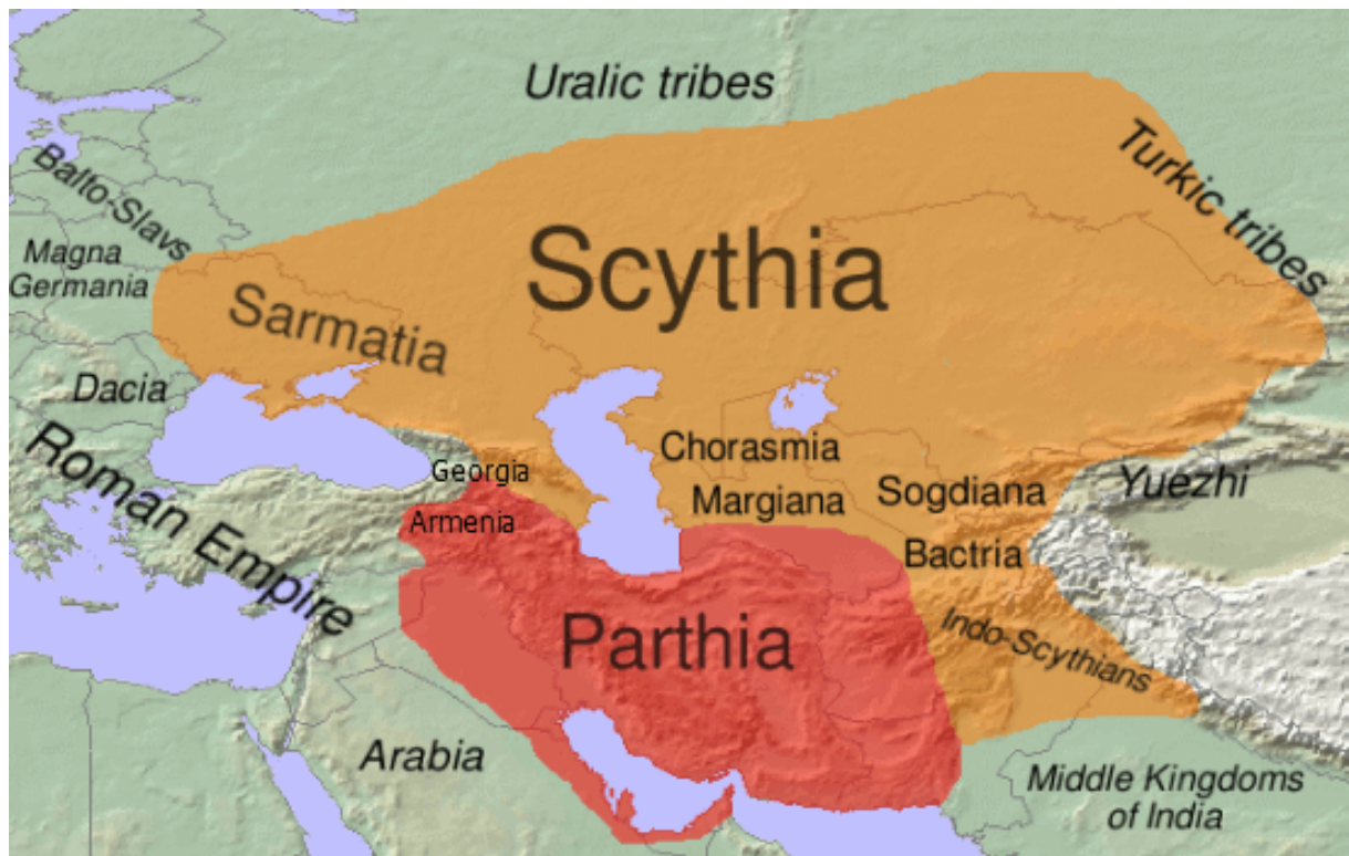
Skythové a Sarmati