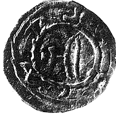
Stříbrný denár Měška I. Na aversu motiv kostela s křížem, legenda OCZLTM (zkomolené jméno Misco), na reversu jednoduchý rovnoramenný kříž.

Když Měšek nastoupil na knížecí stolec, 47 začal osvědčovat své duševní schopnosti i tělesnou zdatnost a častěji úspěšně napadal okolní národy. Dosud se však zmiatal v pohanském poblouznění, protože žil podle svého zvyku se sedmi manželkami. Nakonec požádal o ruku jednu velmi dobrou křesťanku z Čech jménem Doubravka. 48 Ta se však bránila provdat se za něho, neopustí-li onen zvrácený způsob