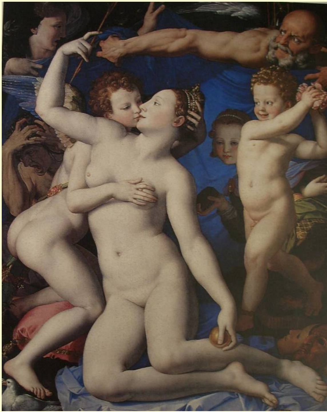
Agnolo Bronzino, Alegorie s Venuší a Amorem (1545)