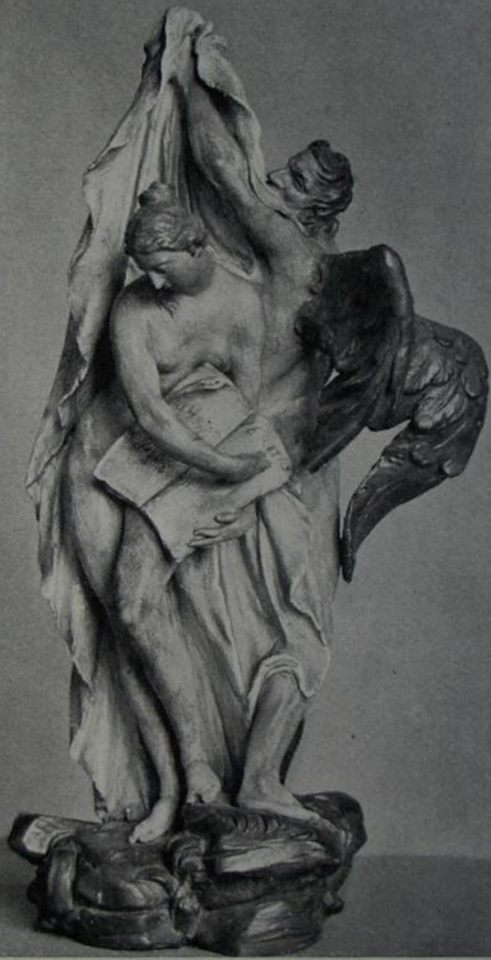
Čas odhaluje Pravdu (Fridr. Wilh. Beyer, kol. 1770)