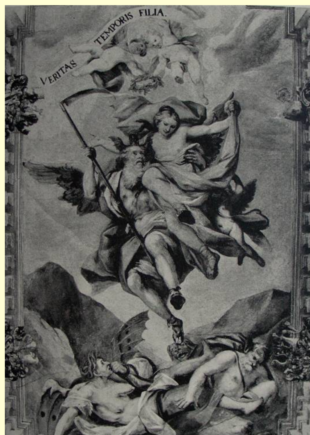
Čas vysvobozuje Pravdu před Závistí a Pomluvou (Joh. Ferd. Fromiller, 1740)