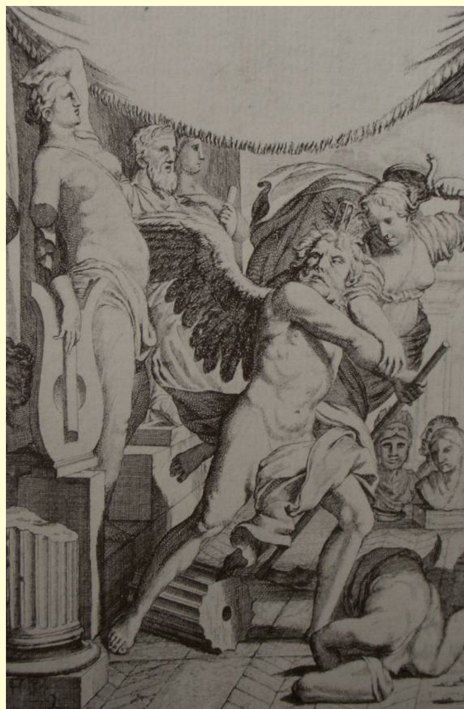
Moudrost ochraňuje umění (hudbu) před časem (17./18. století)