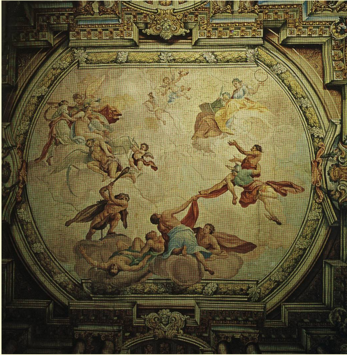
M. Von Görz, Apoteóza rodu Attem (Graz)