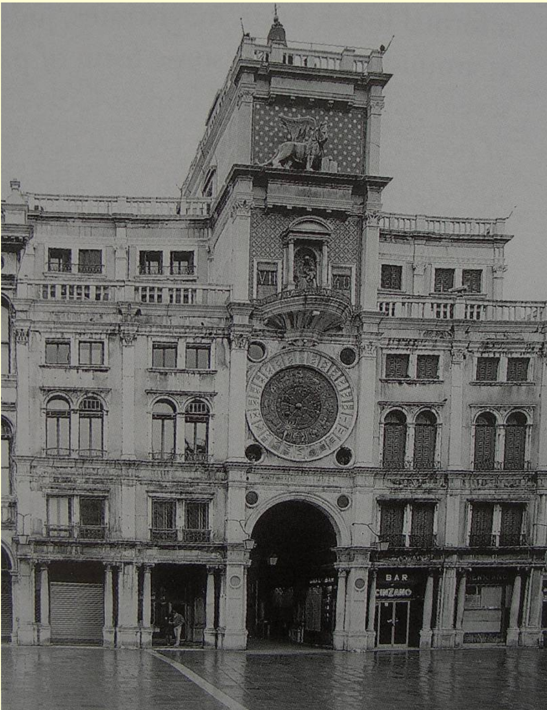
Torre dell' Orologio (1495–9, Benátky, Piazza San Marco):

Hodiny, resp. horologia či orloje na městských radnicích se začaly objevovat od 14. století a postupně se staly symbolem toho, co historikové nazývají desakralizací času . Jedná se o proměnu autorit, které mají pravomoc určovat a strukturovat denní čas obyvatel. Zatímco pro středověkou společnost bylo typické strukturování času církevní vrchností (kláštery s jejich monastickým způsobem členění dne dle tzv. kanonických hodin), s rozvojem měst docházelo k přebírání autority městskými radami. J. Le Goff napsal, že mechanicky, přesně měřený čas městských obchodníků a řemeslníků vytlačil během renesance čas církevní (klášterní).