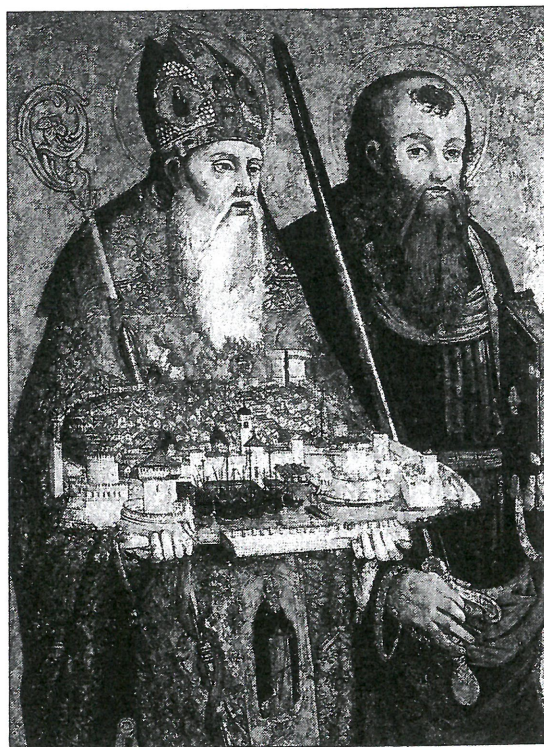
Obraz patrona Dubrovníku sv. Vlaha, držícího v rukou model města

vou státu zůstával kníže ( knez , latinsky rector ), volený původně na jeden rok, pak jen na šest měsíců a od roku 1358 již jen na pouhý měsíc. Postupně se také vyvinula praxe, podle které byl volen z členů Malé rady. Po dobu výkonu své funkce nesměl kníže opustit ze soukromých důvodů palác, služebně se směl vzdálit jen se souhlasem Malé rady. Byl držitelem státní pečeti, v jeho úschově byly tajné státní listiny. Předsedal také jednotlivým radám (vijeće), kde měl však postavení pouhého „prvního mezi rovnými“ (primus inter pares). Původně měl i soudní pravomoc, ta však postupně přecházela na soudy a Malou radu. Funkce knížete byla čestná (neplacená) a jak vidno spíše reprezentativní. V knížecím paláci, přestavěným koncem 15. století, se scházely i jednotlivé rady. Bez ohledu na postavení Velké rady se v delší časové perspektivě moc stále více koncentrovala v senátu. Dubrovník, vyjma městské stráže, která dbala na pořádek ve městě, neměl stále ozbrojené síly a v případě potřeby používal cizí námezdní žoldnéře.