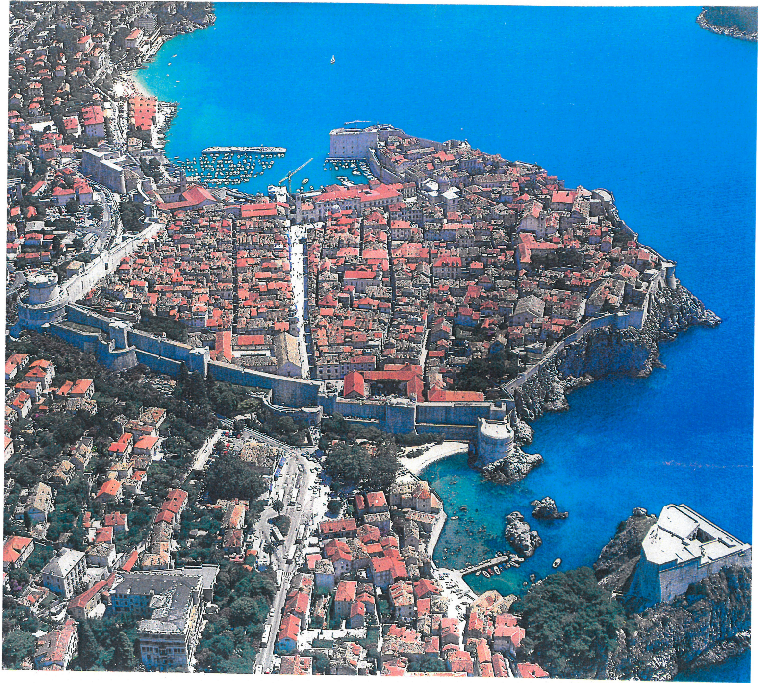
Dnešní pohled na Staré město (v hradebách) Dubrovnik