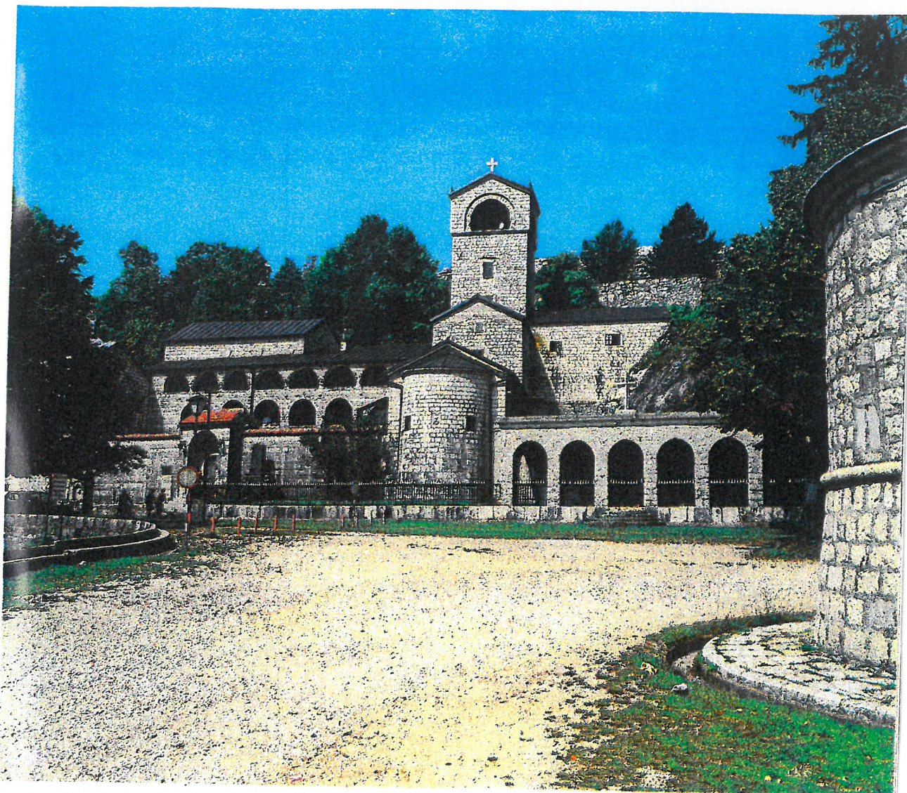
Cetinjski manastir, sadašnji izgled