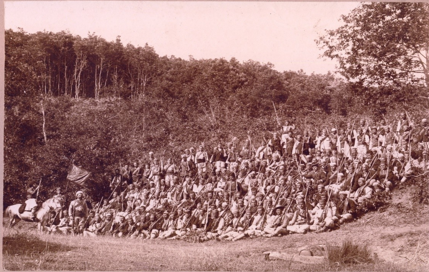
Визитационно к Крчиово 1903. Четана на П. Гуливи.