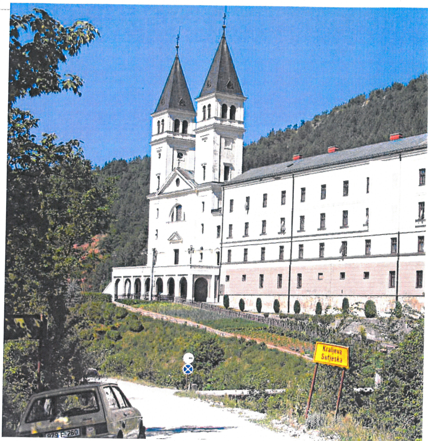
FRANTISKÁNSKÝ KLÁŠTER V BOSNĚ — KRALJEVA SUTJESKA

(klášter byl rozšířen a modernizován přestavbou P. 19. Hobeš)