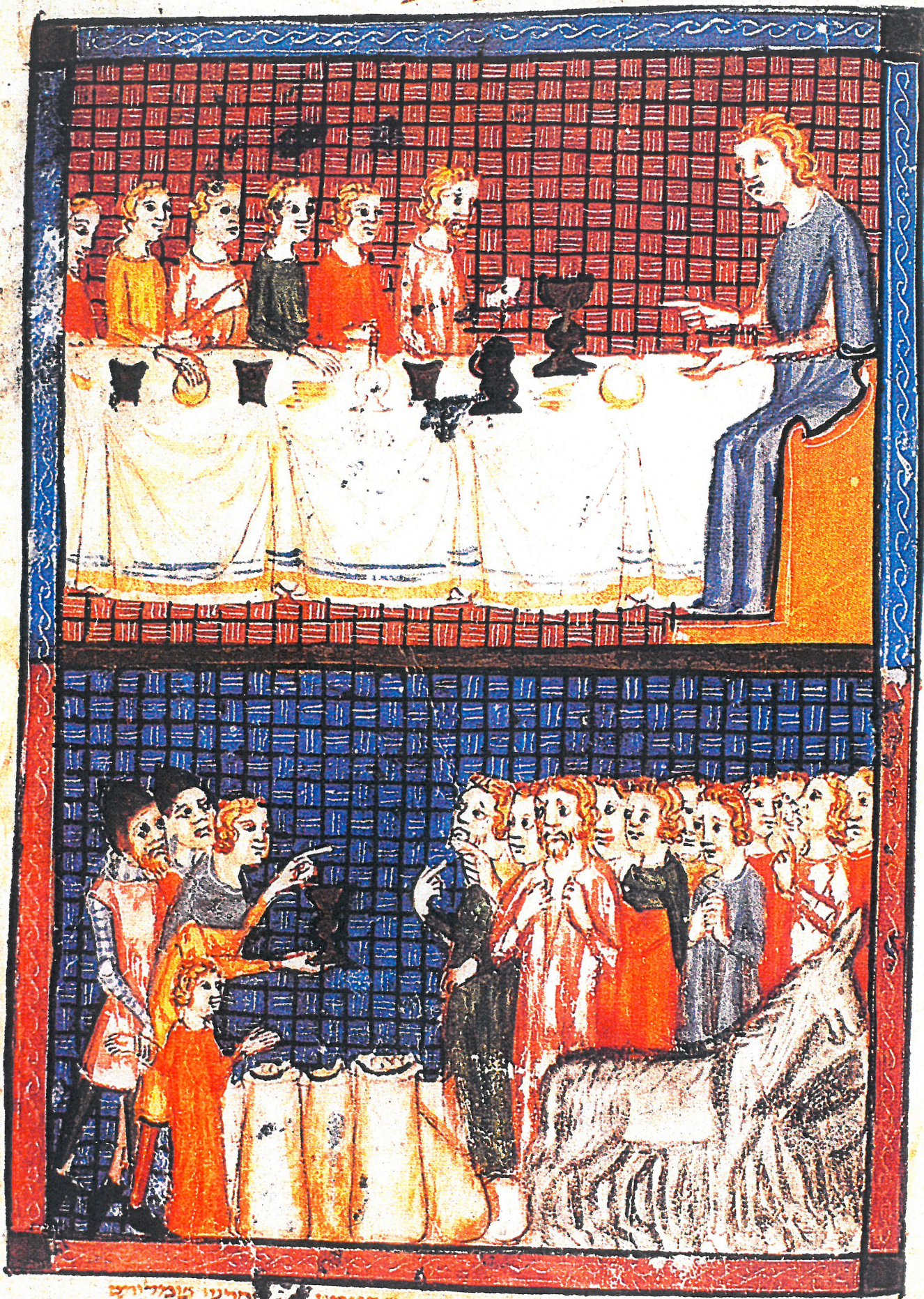
ilustrovana strana ze sarajevske Hagady