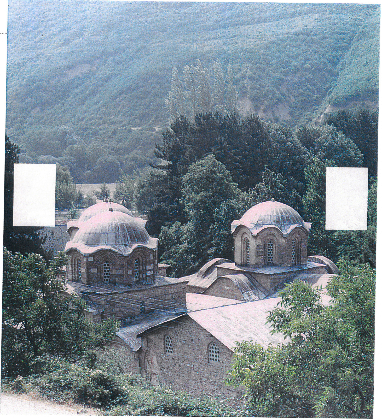
PRAVOSLAVNÝ KLÁŠTER V PEČI