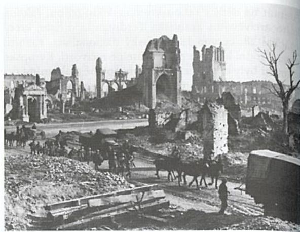
Obr. 5.1 Konvoj koní a povozů míjející za první světové války trosky kostela svatého Martina a Tržnici sukna v belgickém Ypres.

Válka však také ukončila představu „křesťanstva“. Tato myšlenka se již z velké části zdiskreditovala v době fragmentace Evropy za dozvuků Francouzské revoluce (4.1.8). Nyní však dostala smrtelnou ránu, ze které se již nikdy nevzpamatovala. Evropské křesťanské státy spolu pravidelně vzájemně bojovaly v minulosti – ale ještě nikdy s takovým zápletem.