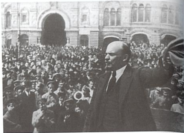
Obr. 5.2 Ruská revoluce, říjen 1917. Vladimir Iljič Lenin (1870–1924) při proslovu k davu na Rudém náměstí v Moskvě.

Ruská revoluce roku 1917 se udála ve dvou fázích. K prvotnímu povstání proti carskému režimu došlo na počátku roku v Petrohradě, tehdejší hlavním městě Ruska. Tato „únorová revoluce“ (i když k ní ve skutečnosti, podle západního kalendáře, došlo v březnu) se udála na pozadí obrovských ruských ztrát v první světové válce a rostoucího vystřízlivění z carské politiky. V chaosu situace převzali členové Dumy, ruského carského parlamentu, moc a prohlásili se za provizorní vládu státu. Car a jeho rodina byli umístěni do domácího vězení. V této fázi bylo záměrem ruských revolucionářů zavést do zhroutené říše liberální demokracii.