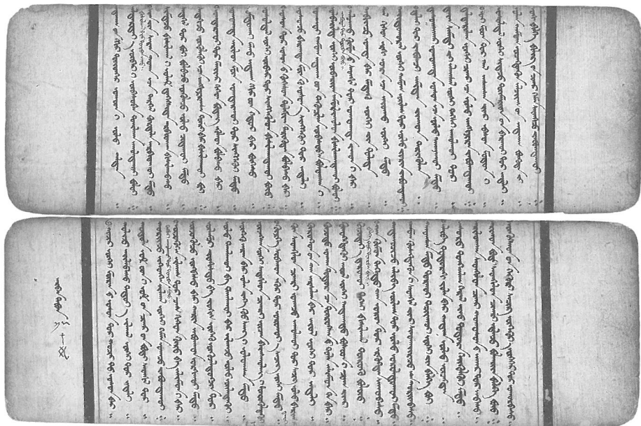
Mongolský rukopis ze 17. století buddhistického překladového textu pocházejícího pravděpodobně z 15. století (zmenšený obrázek)