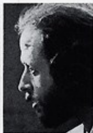
BARRE PHILLIPS kontrabas