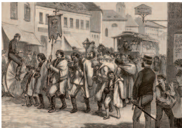
Anachronické způsoby náboženského chování vesničanů jako např. poutní průvody se stávaly kuriozitou. Zobrazení zachycuje takové vnímání ze strany redaktorů vídeňských novin. Ti procesí z Moravy do Mariázell konfrontovali s technickými vymoženostmi, které ve zkratce charakterizovaly dobu.

Jak vidno, vrchnostenské zásahy do nábo-ženského života obyvatel byly vedeny formou zavádění novinek a zákazů jednotlivých způ-sobů chování (rituálů), které byly realizovány venkovany během jednotlivých svátků až po celé sváteční příležitosti. Zejména po ode-znívání osvětského vzepětí státního aparátu se setkáváme ještě s jiným normativním diskurzem, a to opětovným povolováním. Razance osvětských zásahů do náboženských festivity totiž poněkud předběhla svoji dobu a roli sehrála jistě také změna na vídeňském trůnu po skonu Josefa II. v roce 1790. Tak již např. následujícího roku bylo biskupům umožněno s vědomím úřadů povolovat poutní průvody, avšak jejich obecný zákaz trval až do roku 1820. 51