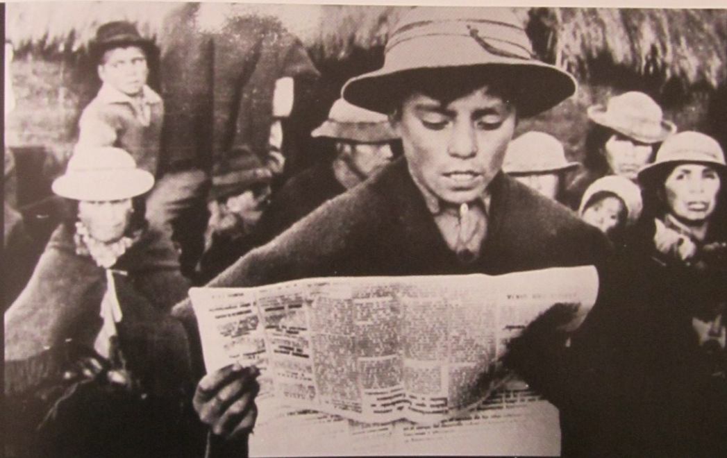
Fuera de aquí