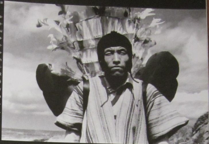
La nacion clandestina

MALLKU, kdy v jedné chvíli filmařům rovněž hrozil útok ze strany špatně informovaných vesničanů. Komedie Pro ptáčí zpěv, kde epizodní roli Francouzky usazené v Andách vytvořila dokonce mezinárodní hvězda Geraldine Chaplinová, odpovídá současnému nerevolučnímu času Latinské Ameriky. „Pád berlínské zdi a rozpad socialismu ve východoevropských zemích ochromil latinskoamerickou levicei,“ lituje Sanjinés. „Neoliberalní teze tzv. divokého kapitalismu, že trh se stane univerzálním prostředkem na všechno, má na levicei demobilizující účinek... Nezdár prvního nárazu kapitalismu v bývalém SSSR nás však nutí socialistický model znovu promyslet a jisté věci řešit nově, zvláště důležitost individuální svobody a hodnotu osobní iniciativy. Podle mého mínění bude po těchto událostech trvat velmi dlouho, než vznikne nová, lidštější a spravedlivější civilizace. Není divu, že jsme nyní, v bouři konjunktury, dezorientováni.“