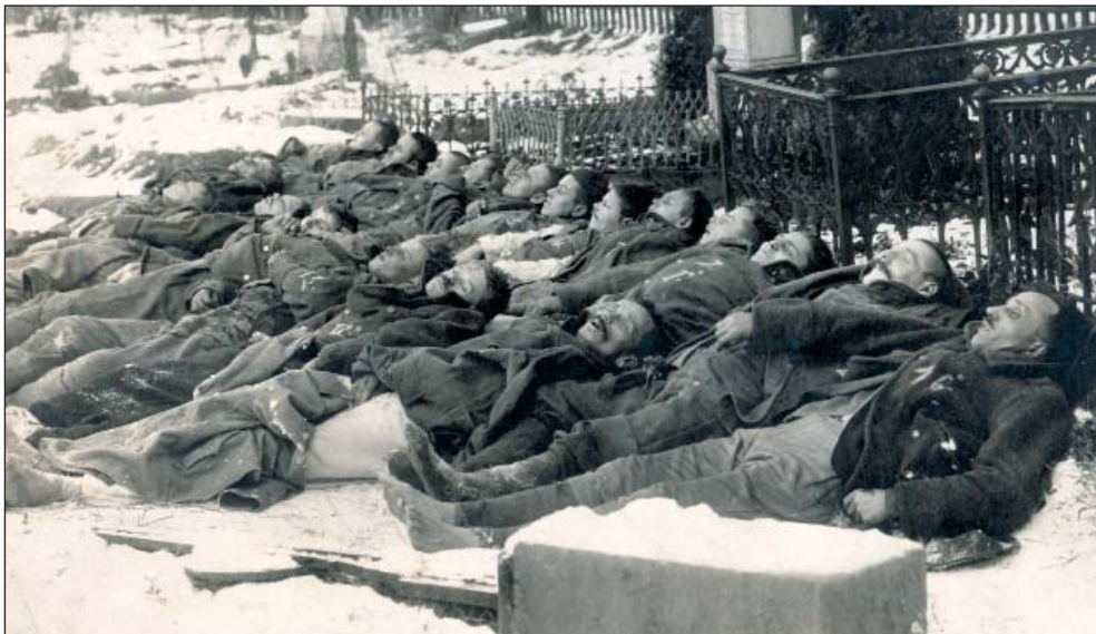
Polské oběti sedmidenní války před pohřbením na hřbitově ve Stonavě