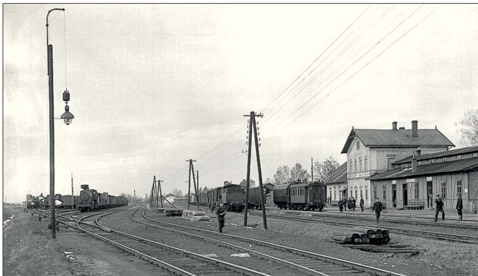
Nádraží v Žibřidovicích, r. 1919