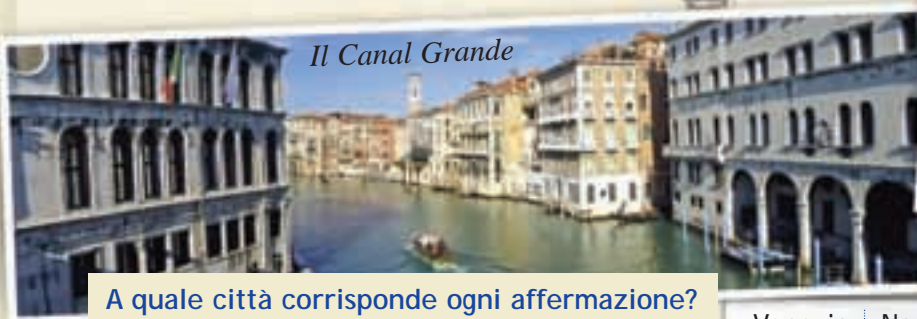
Il Canal Grande

Milioni di turisti ogni anno restano incantati* da questa città e dai suoi tesori d’arte che rischiano di finire sott’acqua, poiché Venezia “affonda” lentamente (mezzo centimetro all’anno). In Piazza San Marco , cuore del meraviglioso Carnevale, sorge la Basilica di San Marco (1073), il più alto esempio di arte veneto-bizantina anche se in seguito ulteriori interventi hanno lasciato tracce di altri stili (romanico, gotico, rinascimentale). Proprio accanto si può ammirare il Palazzo Ducale, simbolo della gloria* veneziana e residenza del Doge, cioè il capo dell’antica Repubblica marinara di Venezia.