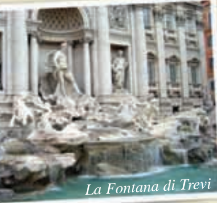
La Fontana di Trevi