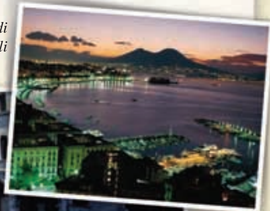
Il Golfo di Napoli

“Vedi Napoli e poi muori” si diceva una volta. Fondata dai greci nel V secolo a. C. con il nome Neapolis (città nuova), è la più importante città dell’Italia del Sud. Situata su un grande golfo, ai piedi del vulcano Vesuvio, è stata per sei secoli la capitale del Regno* di Napoli; di questo periodo glorioso ci rimangono testimonianze artistiche molto importanti. Castel Nuovo o Maschio Angioino (1282) e il Teatro San Carlo sono tra i monumenti più celebri. Napoli è una città affascinante, viva e divertente, dove si mangia bene; la gente, aperta e cordiale, parla il dialetto italiano certamente più musicale. D’altra parte, però, questa città affronta gravi problemi, legati alla disoccupazione e alla criminalità.