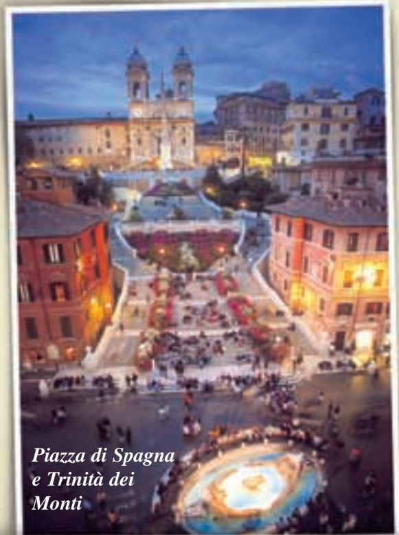
Piazza di Spagna e Trinità dei Monti