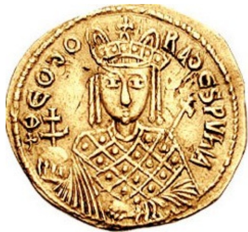
Solidus znázorňující Theodoru jako císařovnu