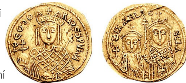
Solidus znázorňující malého Michaela a jeho starší sestru Theklu