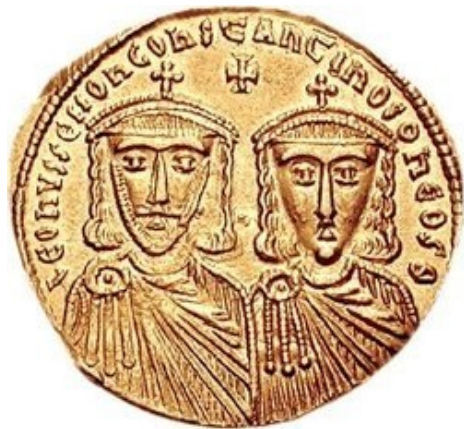
Solidus znázorňující Konstantina V. a mladého Leona IV.