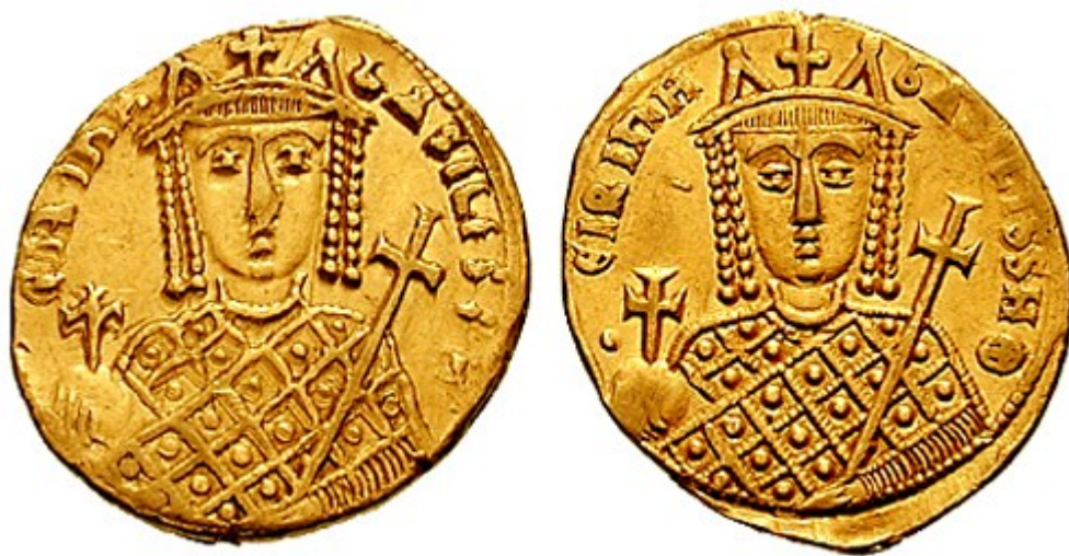
Solidus znázorňující Irenu jako „basilissu“ - císařovnu.