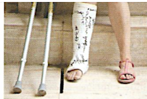
2. перелом ноги милиці