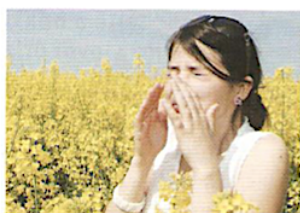
10. У неї алергія.