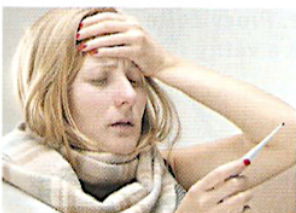
9. У неї грип. У неї гарячка. У неї висока температура.