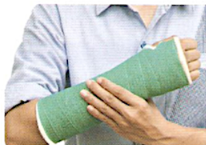
6. перелом руки