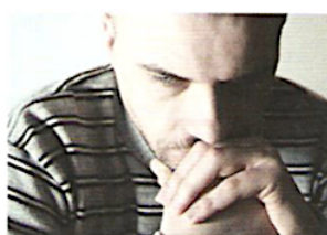
11. У нього стрес / депресія