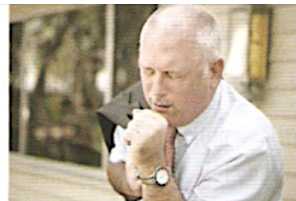
3. У нього кашель