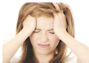
7. Її болить голова.