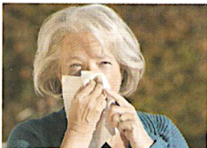
5. У неї нежить.