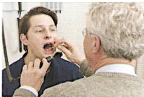
1. У нього ангіна.

Приклад: 1. У нього ангіна. Він повинен піти до лікаря, він повинен пити гарячий чай, приймати ліки, відпочивати... випити (прийняти) таблетку пити ліки