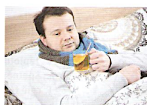
12. У нього грип. Він застудився.