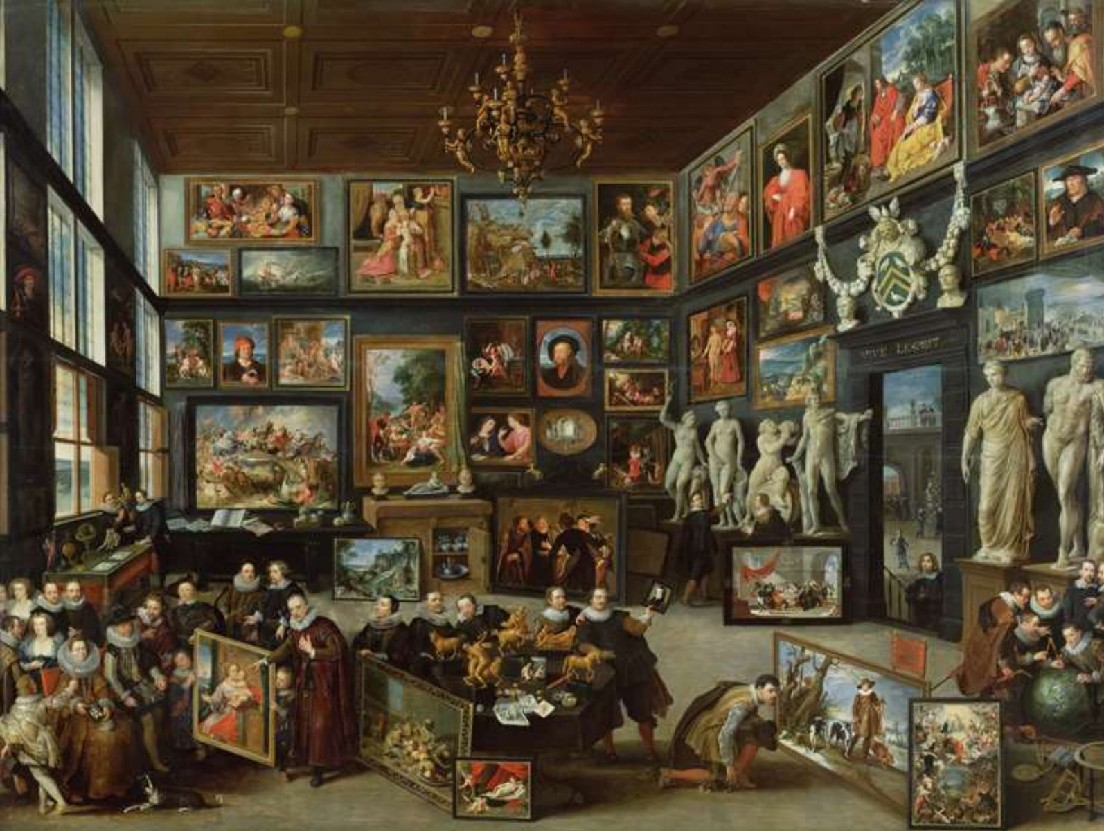
Metody dějin umění (1-3)