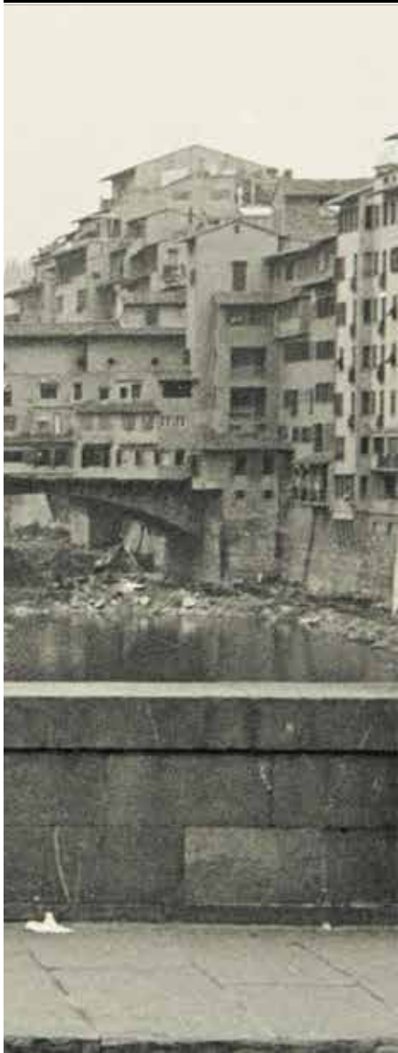
Alessandro Bonsanti sul Ponte di Santa Trinita a Firenze e, sotto, ritratto da Vieri Freccia negli anni trenta, Fondo Letteratura; a destra: Gadda in un deposito di munizioni a Romans d'Isanzo, 1917