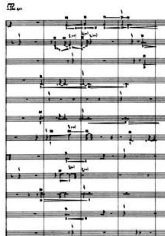
Imaginary Landscape No. 4, page 19

http://www.youtube.com/watch?v=HypmW4Yd7SY