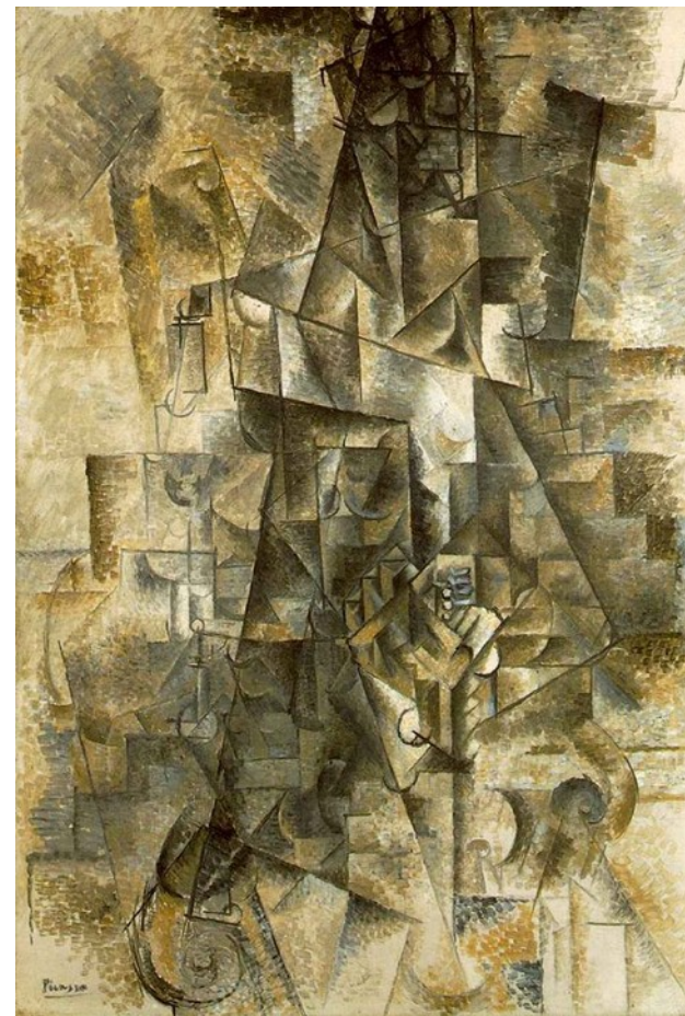
Pablo Picasso: Akordeonista , 1911