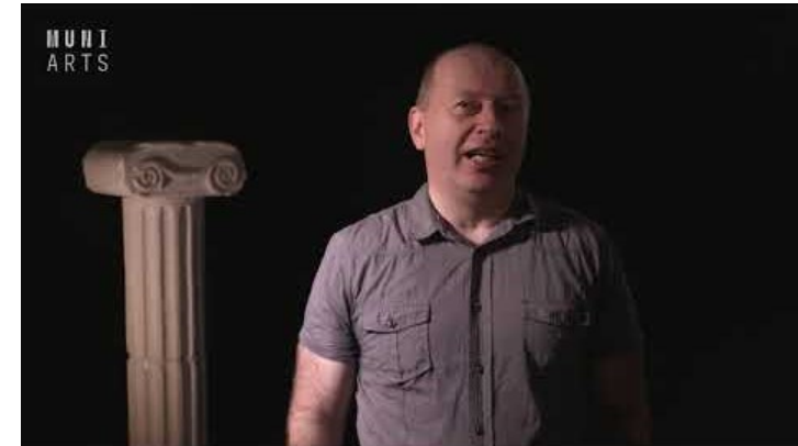
Scénka ilustrující Aristotelovu (a Platónovu) představu o tom, jak filosofie vznikla a co to vlastně je. Viz https://www.youtube.com/watch?v=RKA5R9iD2kc&t=7s

• „Neboť jako dnes, tak v dřívějších dobách lidé začali filozofovat, protože se něčemu divili. Z počátku se divili záhadným zjevům, jež jim bezprostředně ukazovala zkušenost, a teprve potom ponenáhlu postupující naznačenou cestou dospěli i k záhadám významnějším... Ten pak, kdo pochybuje a diví se, má vědomí nevědomosti (...). Jestliže tedy lidé filozovali, aby unikli nevědomosti, je zjevno, že usilovali o vědění proto, aby nabyli vědění, nikoli pro nějaký vnější užitek. (...) A tak vidíme, že tuto vědu [tj. filosofii] nevyhledáváme pro žádný jiný vnější užitek, nýbrž jako říkáme, že svobodný je člověk, jenž je pro sebe a nikoli pro druhého, tak i ona jenom je vědou svobodnou; jenom ona totiž je vědou pro sebe.“