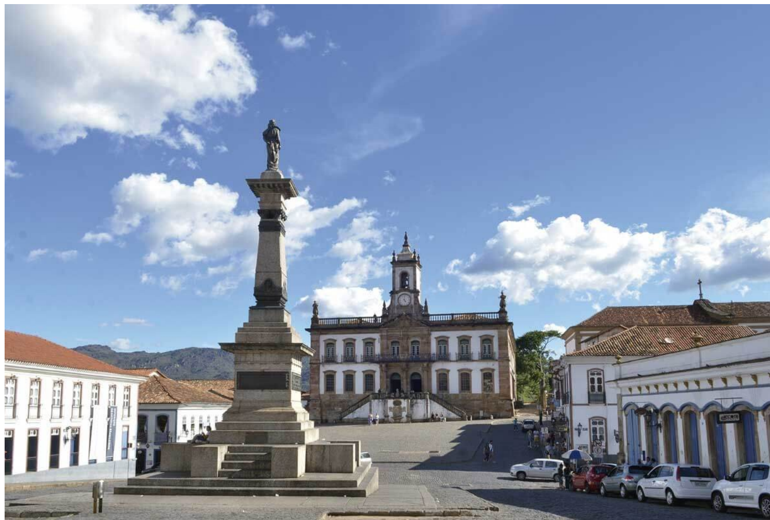
Praça Tiradentes, Ouro Preto, MG