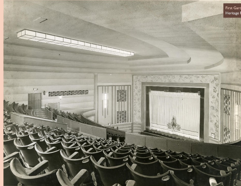
The sumptuous interior of the brand new Broadway Cinema, 1936