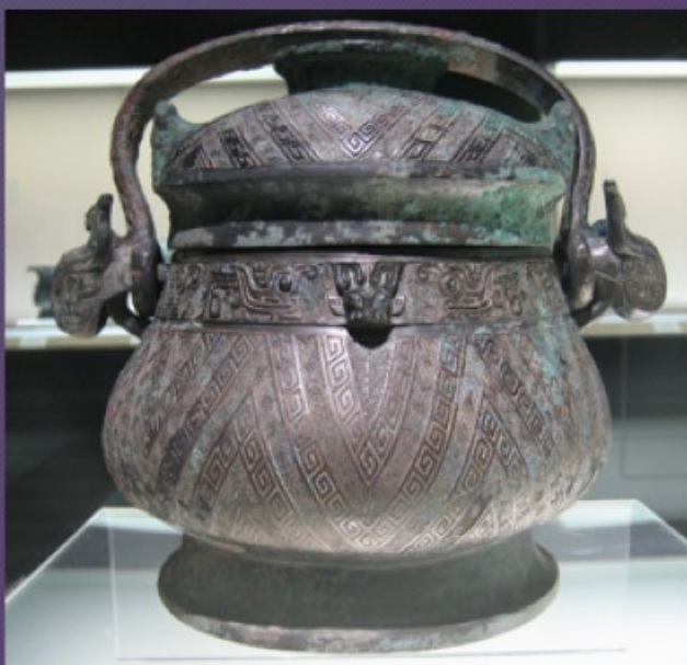
rituální nádoba jou 卣 yǒu