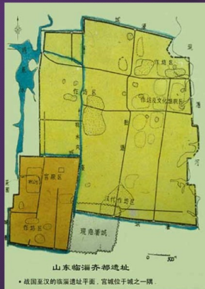
rekonstrukce čchiského hlavního města Lin-c' 臨淄 Línzī