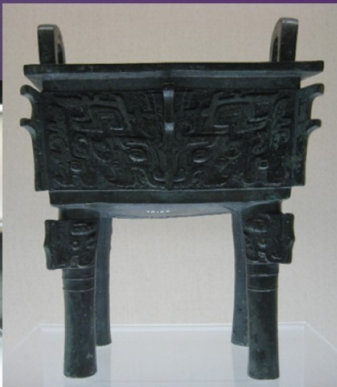
čtyřnohá nádoba fangting 方鼎 fāngdǐng