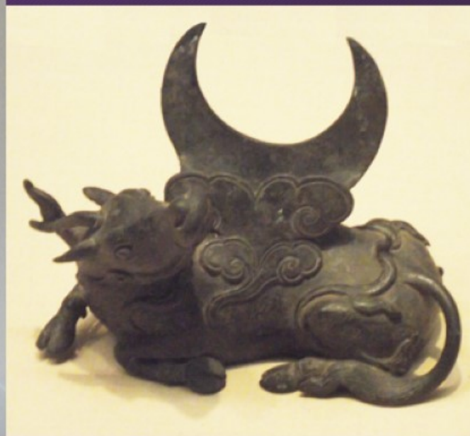
držák na bronzové zrcadlo, kolem 1000 př. n. l.