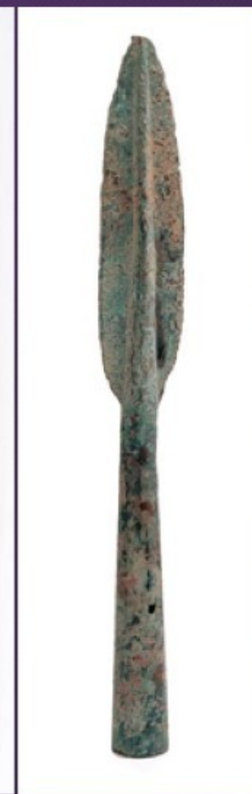
jadeitová dýka špička kopí