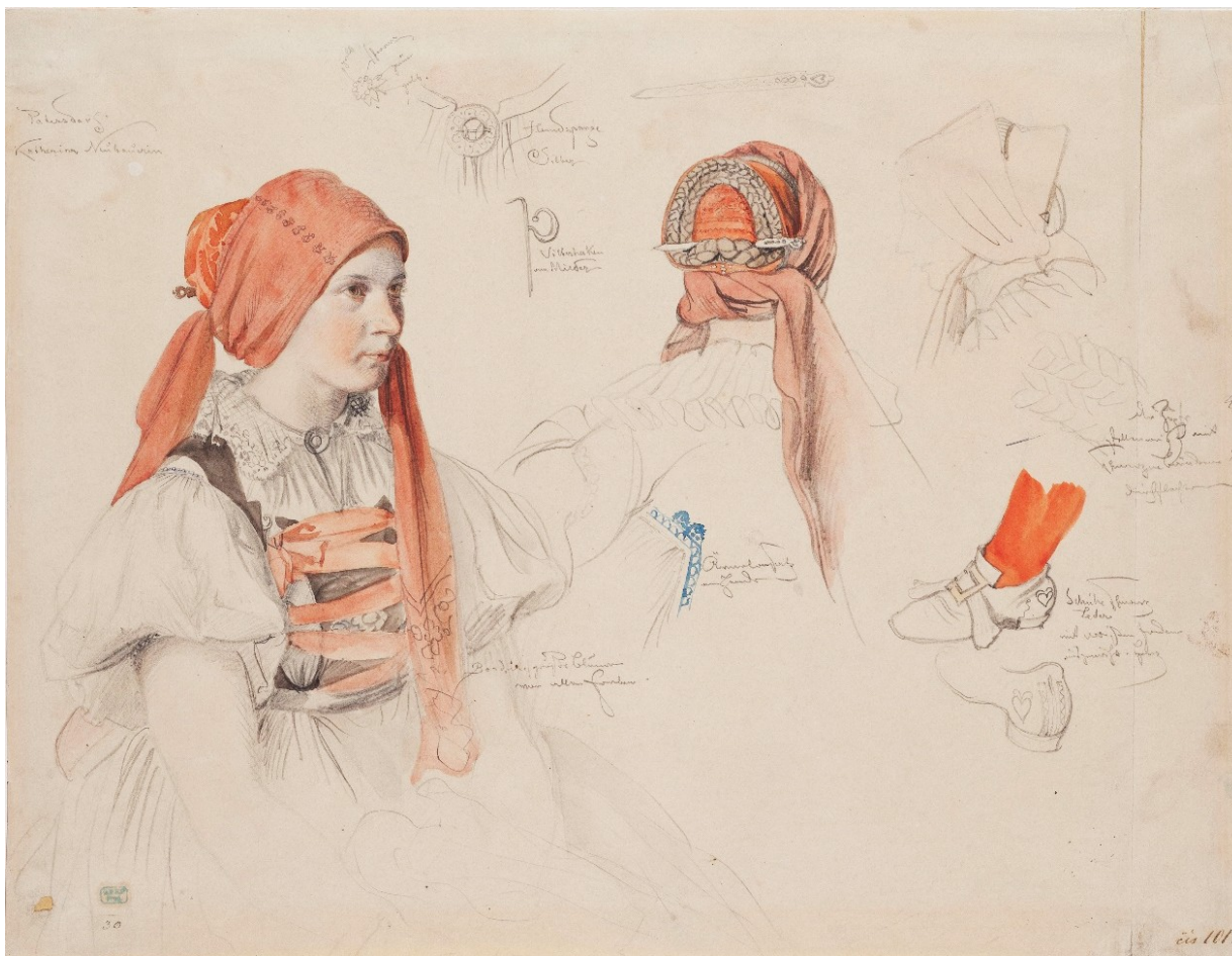
Dívka z Bartoušova v obřadním kroji, J. Mánes, 1854