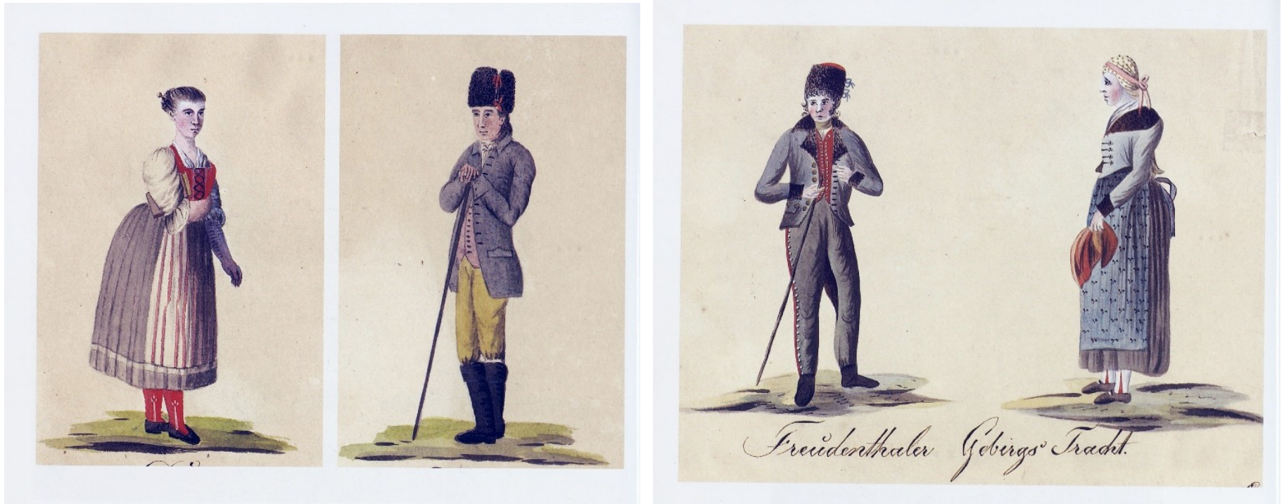
Oděv českých obyvatel Opavska, Bruntálský horský kroj, Kvaše 1814