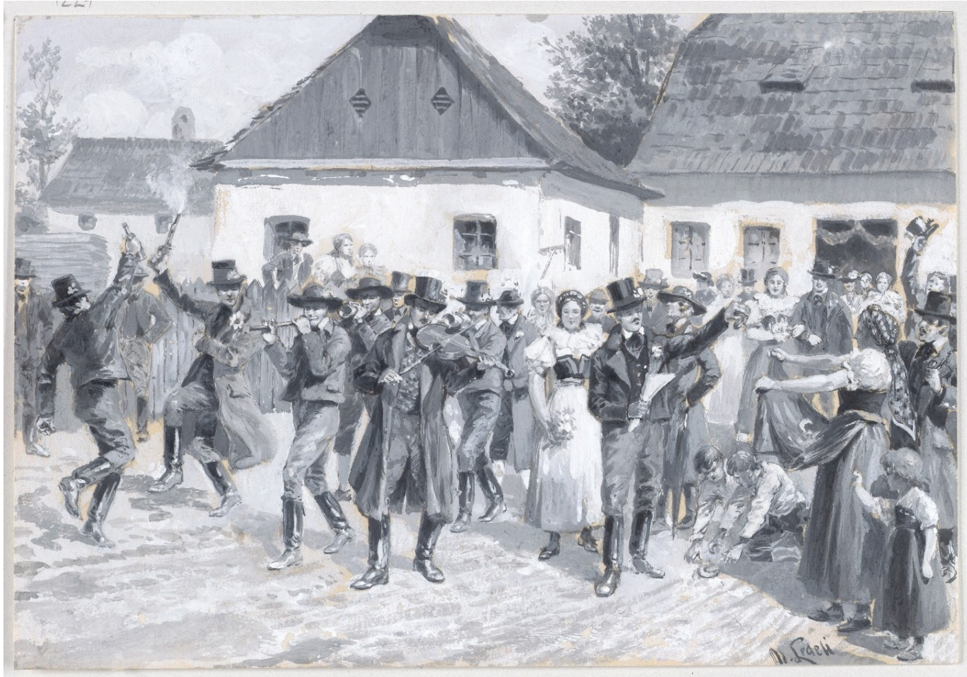
Selská svatba z Hřebečska, M. Ledeli, 1897