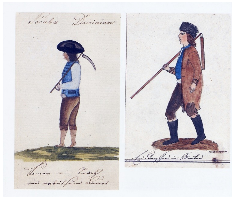
Poruba, pracovní oděv, Kvaše 1814