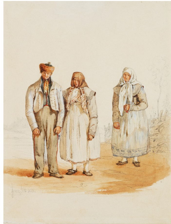
Obyvatelé Opavska, J. Alt 1843