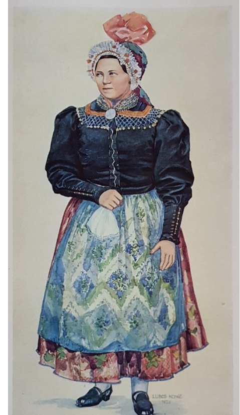
Tab. 47. L. Kopáč: Nevěsta z humpoleckého Zálesí z konce 19. století • Невеста из Гумпольецкого Залесья. Конец 19 в. • A bride from Zálesí near Humpolec at the end of the 19th Century • Mariée de Zálesí près Humpolec vers la fin du 19 ème siècle

Muži a žena z Humpoleckého Zálesí, L. Kopáč, konec 19. století