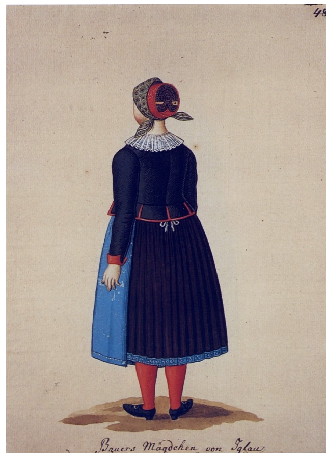
Svobodná dívka z Jihlavska, Kvaše 1814