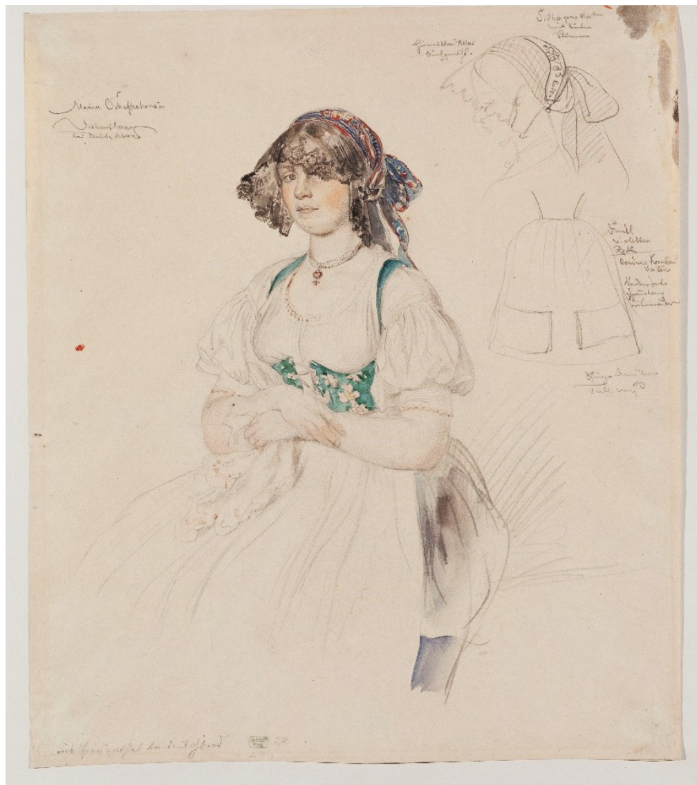
Dívka z Havlíčkova Brodu v obřadním kroji, J. Mánes, 1854