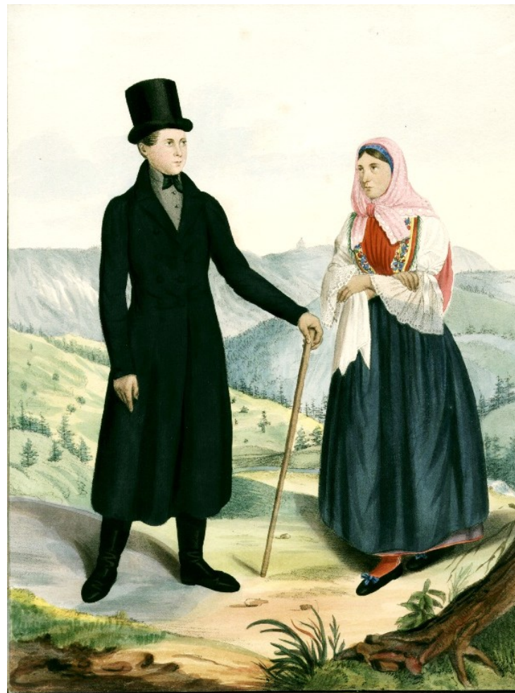
Svobodný a vdaný pár z Kravařska, W. Horn 1837