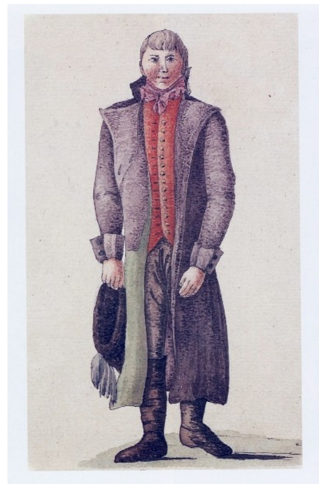
Oděv obyvatel Opavska, Kvaše 1814