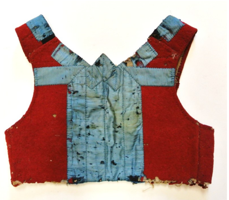
Živůtek sukně z Vražného na Novojičínsku