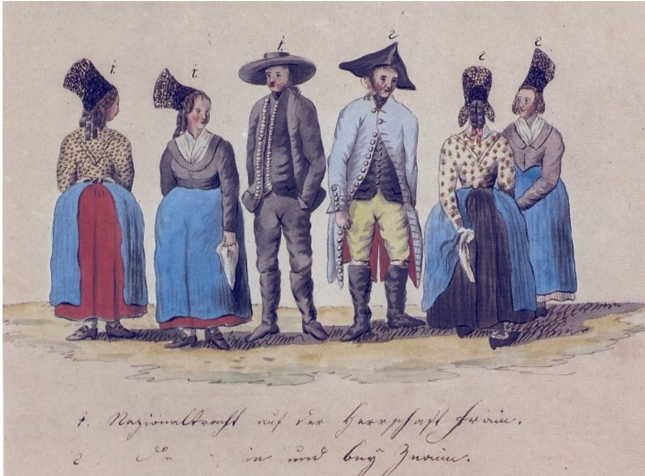
Obyvatelé panství Vranov nad Dyjí a okolí Znojma, Kvaše 1814