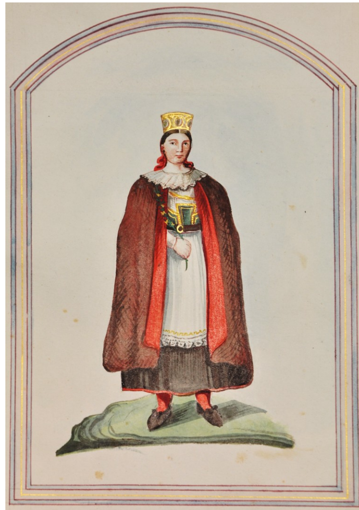
Družička a nevěsta z Moravskotřebovska, 1820