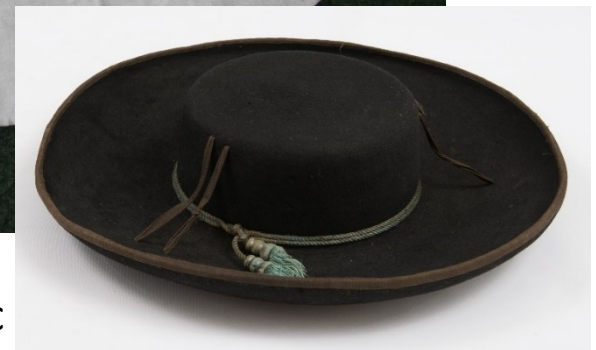
Mužský klobouk a kabát župan , Muzeum Humpolec