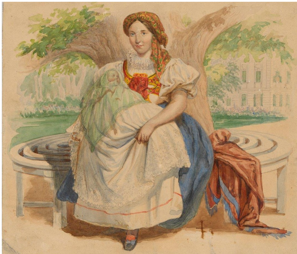
Chůva korunného prince Rudolfa, F. Kollarz, 1859