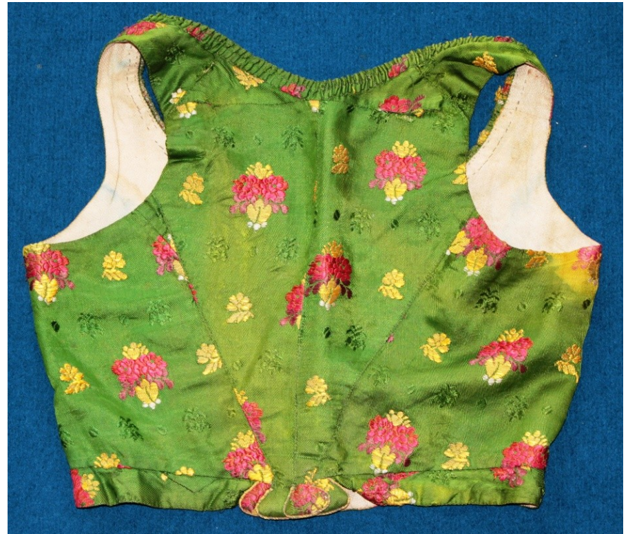
Ženská vesta, Městské muzeum Velké Meziříčí, konec 19. století