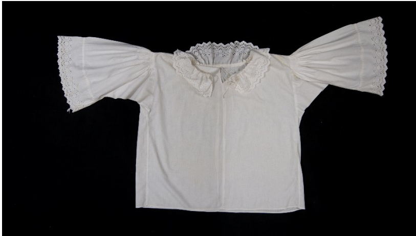
Košilka, plátěná a tylová zástěra, Počátek 20. století