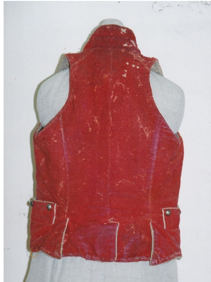
Mužská vesta s jednořadovým zapínáním, Hlinecko, polovina 19. století.