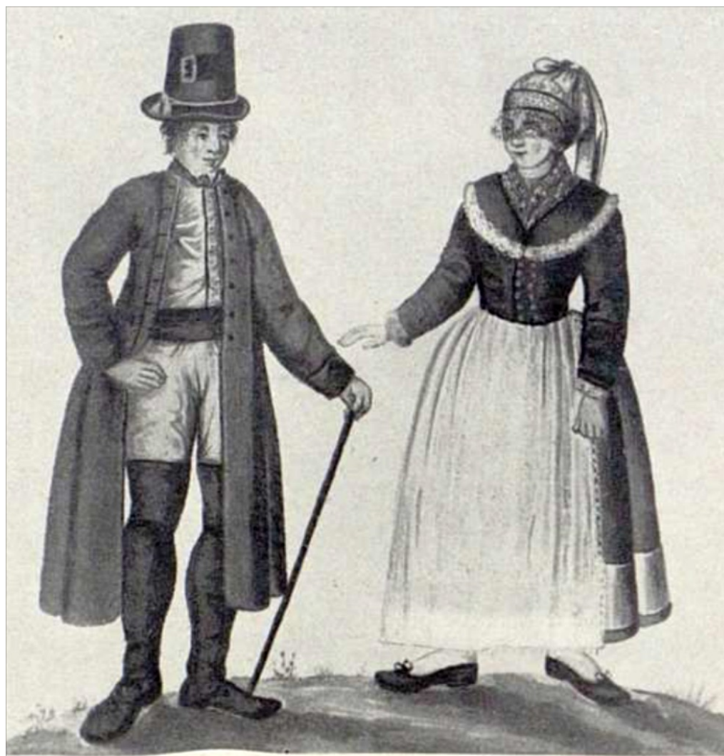
Obyvatelé panství Okrouhlice, kolem roku 1836