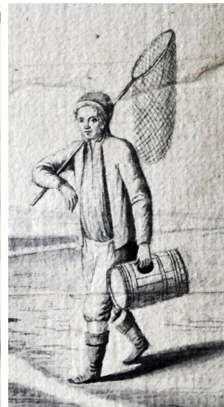
Venkované z Jihlavska, Porostní mapy panství města Jihlavy, 1779