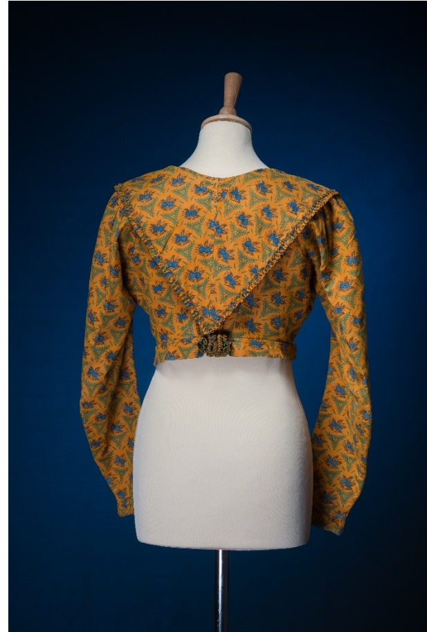
Ženský kabátek, konec 19. století