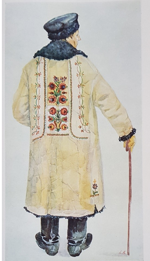
Tab. 45. L. Kopáč: Sedlák z Humpolecka v kožichu z konce 19. století • Крестьянин из Гумпольецкого края в полушубке. Конец 19 в. • Peasant from the Humpolec region in furcoat, late 19th Century • Paysans de la région de Humpolec en pelisse vers la fin du 19 ème siècle