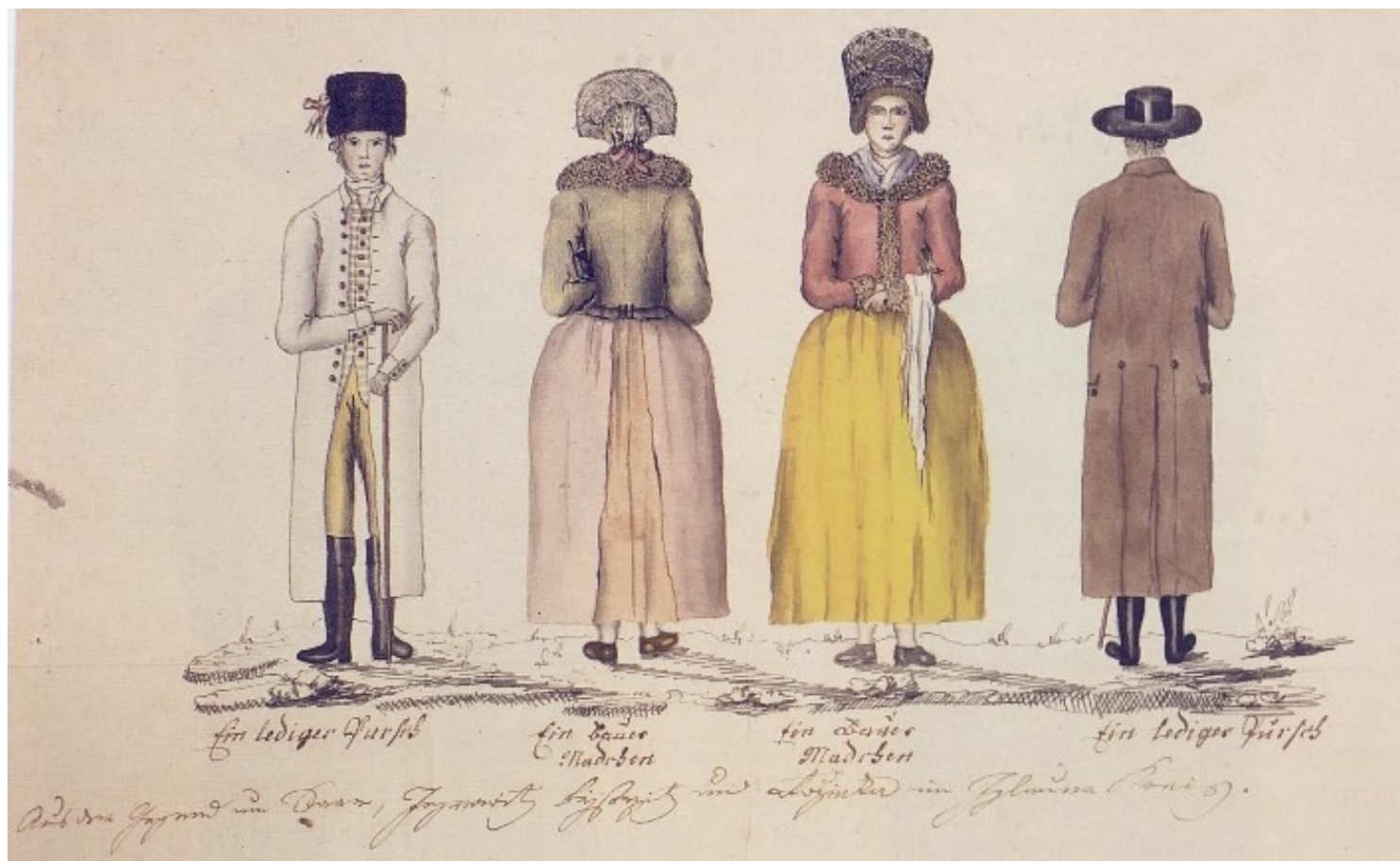
Obyvatelé z okolí Žďáru, Jimramova, Bystřice a Rožínky, Kvaše 1814