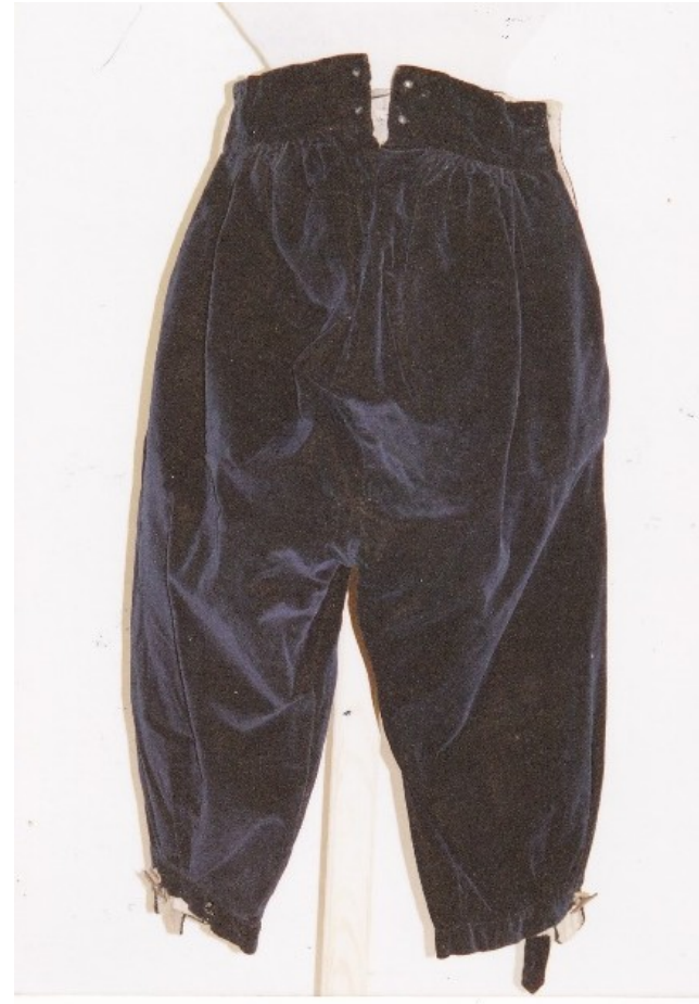
Krátké kožené kalhoty, Hlinecko, konec 19. století, muzeum Vysoké Mýto