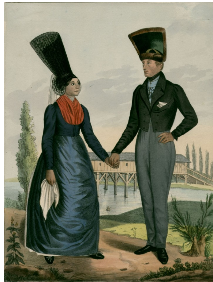
Svobodný pár z Rožínky a Znojma, W. Horn 1837