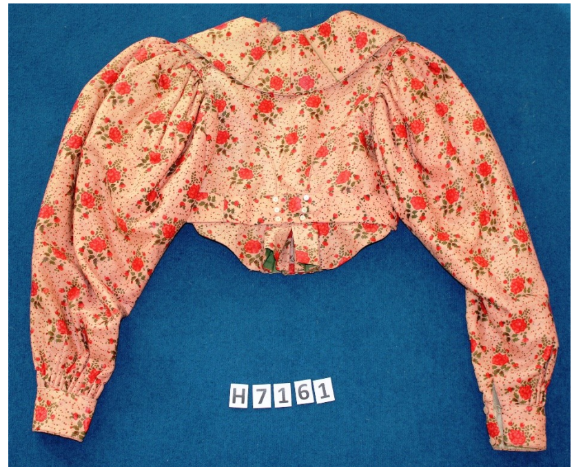
Ženský kabátek špenzer, konec 19. století