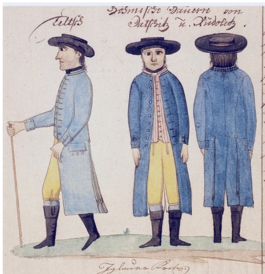
Německý a český sedlák z okolí Slavonic, Dačic a Rudolce, Kvaše 1814