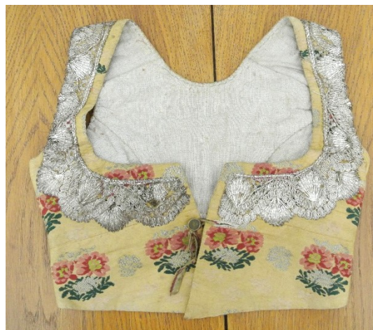
Jeseník nad Odrou