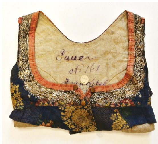
Suchdol nad Odrou