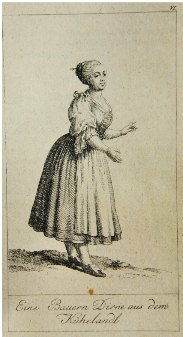
Obyvatelé Kravařska, S. Mansfeld 1786