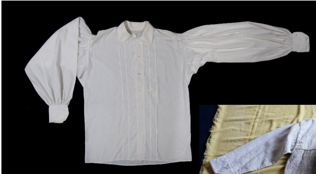
Mužská bavlněná a konopná košile, přelom 19. a 20. století