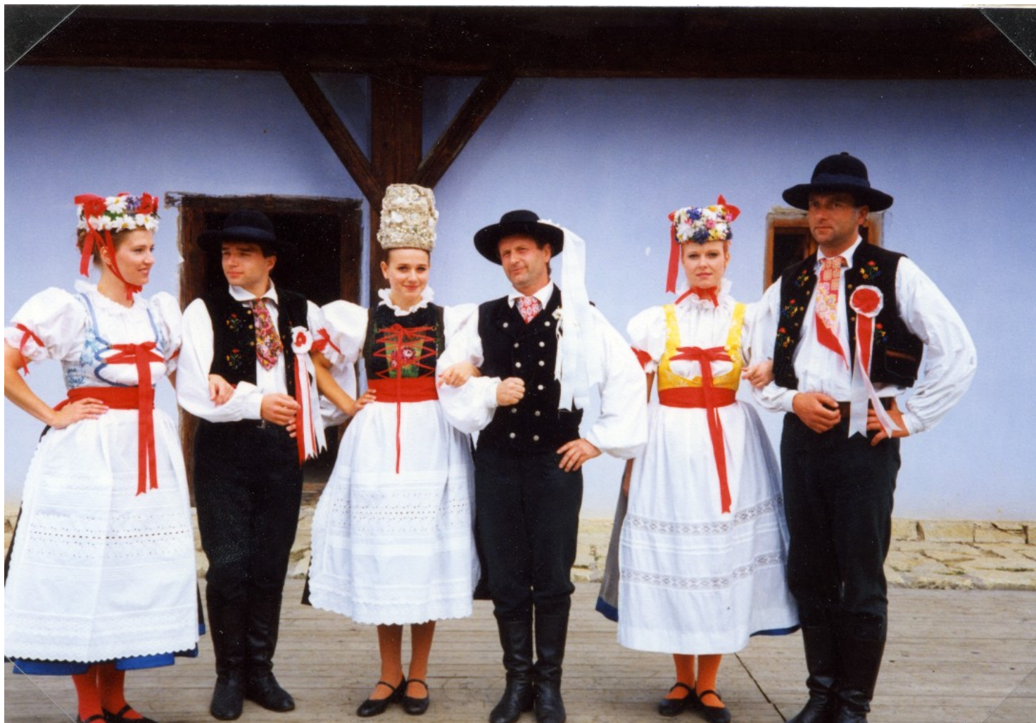
Současná folkloristická rekonstrukce Jihlavské kroje