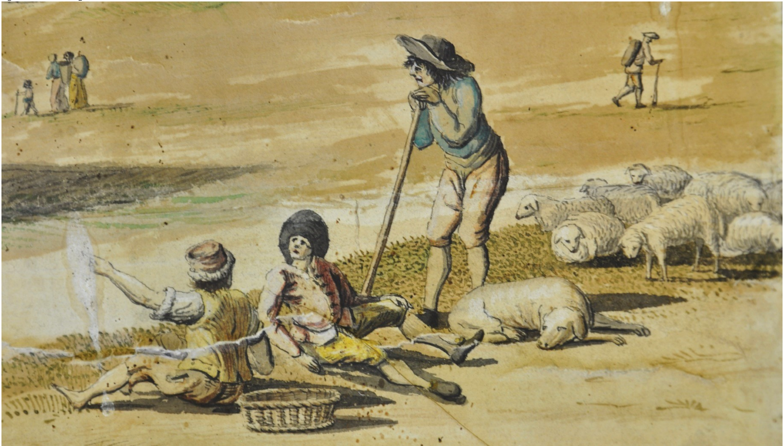
Mapa polesí Velké Heraltice, oděv pasáků ovcí, J. Spour 1773