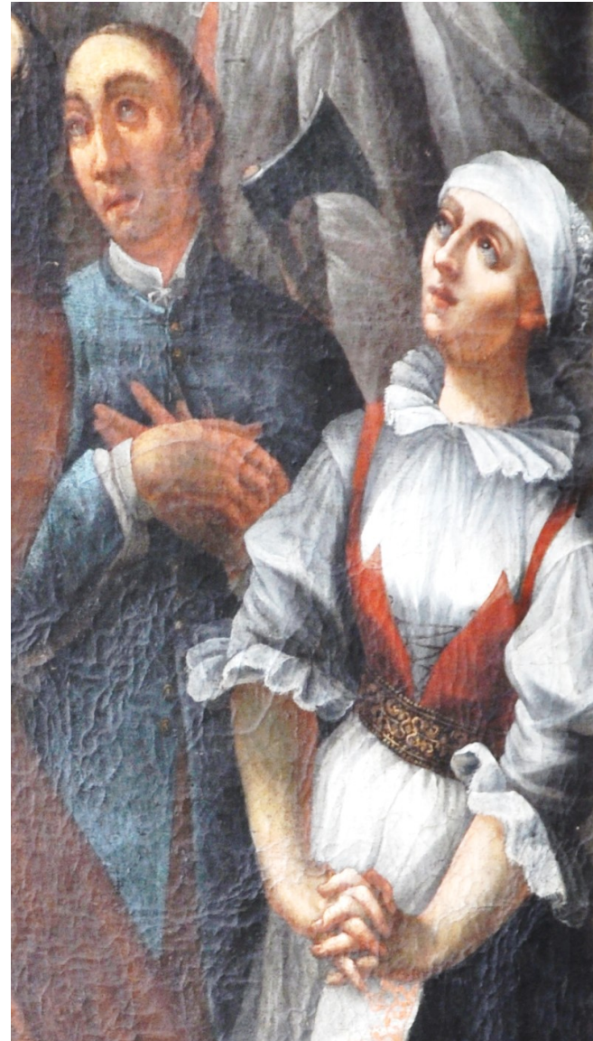
Adorace sv. Vendelína, A. Wolny, 1772