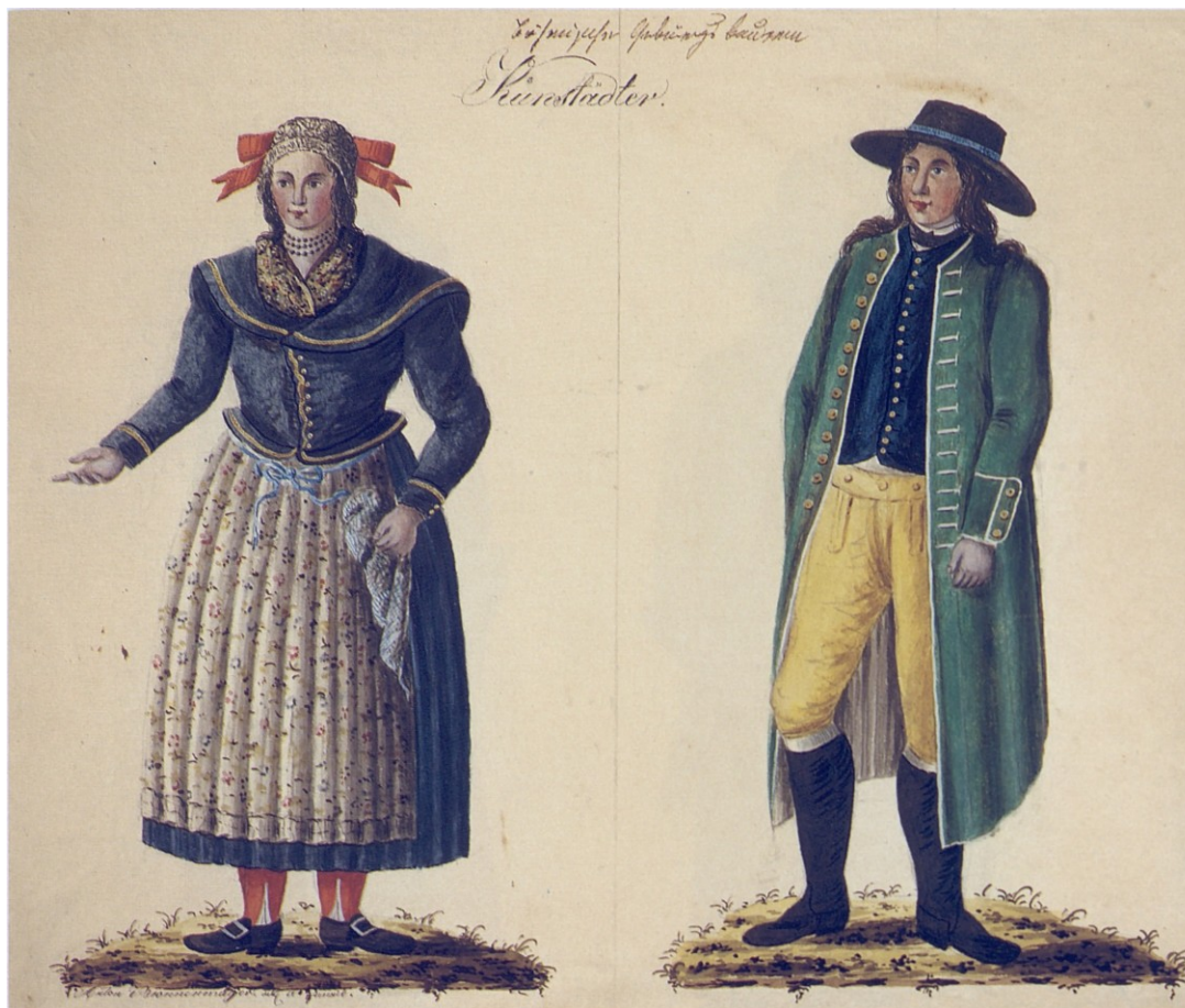
Čeští sedláci z hor, obyvatelé Kunštátu, Kvaše 1814