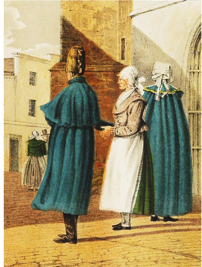
Obyvatelé Jesenicka a Opavska, J. Alt 1843