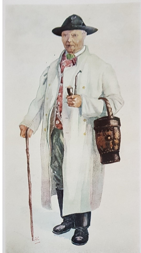
Tab. 46. L. Kopáč: Sedlák v bílém šupanu z Mýslétina u Humpolce z konce 19. století • Крестьянин в белом кафтане из Мыслетина. Конец 19 в. • Peasant from Mýslétin near Humpolec in white coat, late 19th Century • Fermier en manteau blanc de Mýslétin près Humpolec vers la fin du 19 ème siècle