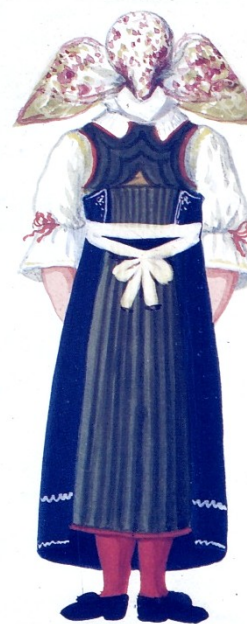
Obyvatelé Moravskotřebovska, Kvaše 1814