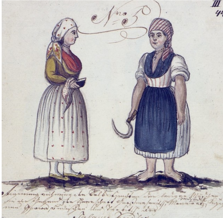
Oděv svobodných dívek ze severní části Horácka, Kvaše 1814