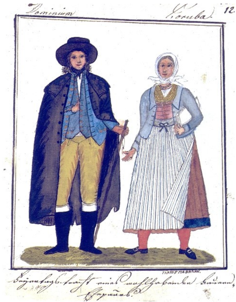
Poruba, sváteční oděv, Kvaše 1814