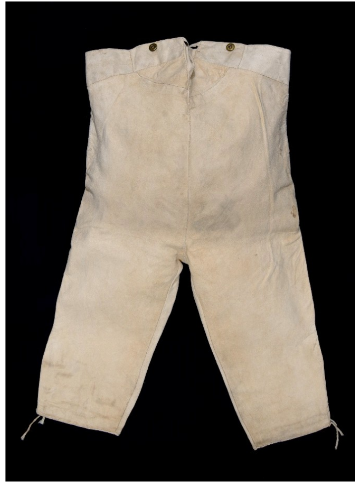
Krátké kožené kalhoty, Velké Meziříčí, konec 19. století