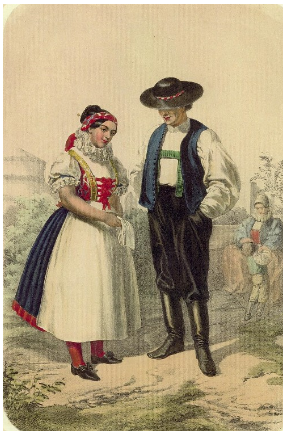
Dívka z Jihlavy v obřadním kroji, J. Mánes, 1854 Svobodný pár z Jihlavska, F. Kalivoda, 1857