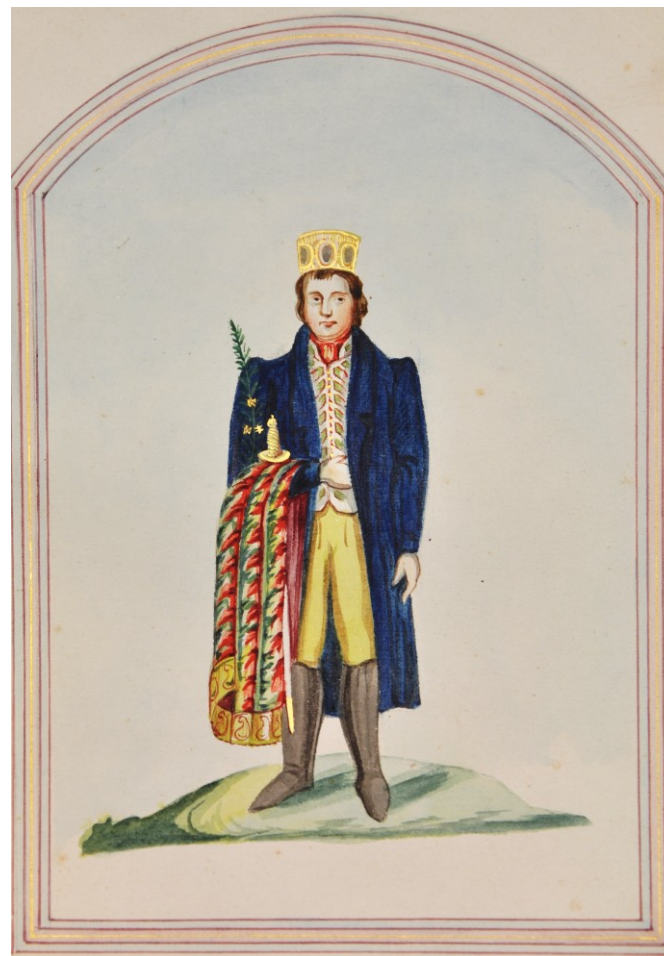
Družba a ženich z Moravskotřebovska, 1820