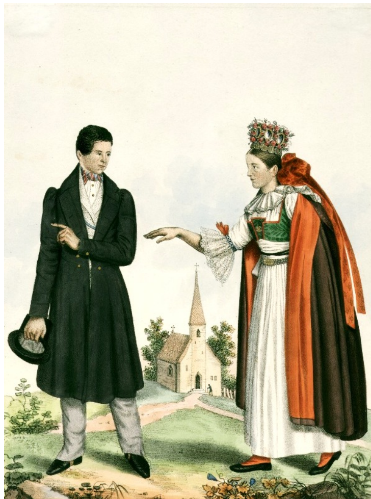
Ženicha nevěsta z Moravskotřebovska, W. Horn 1837