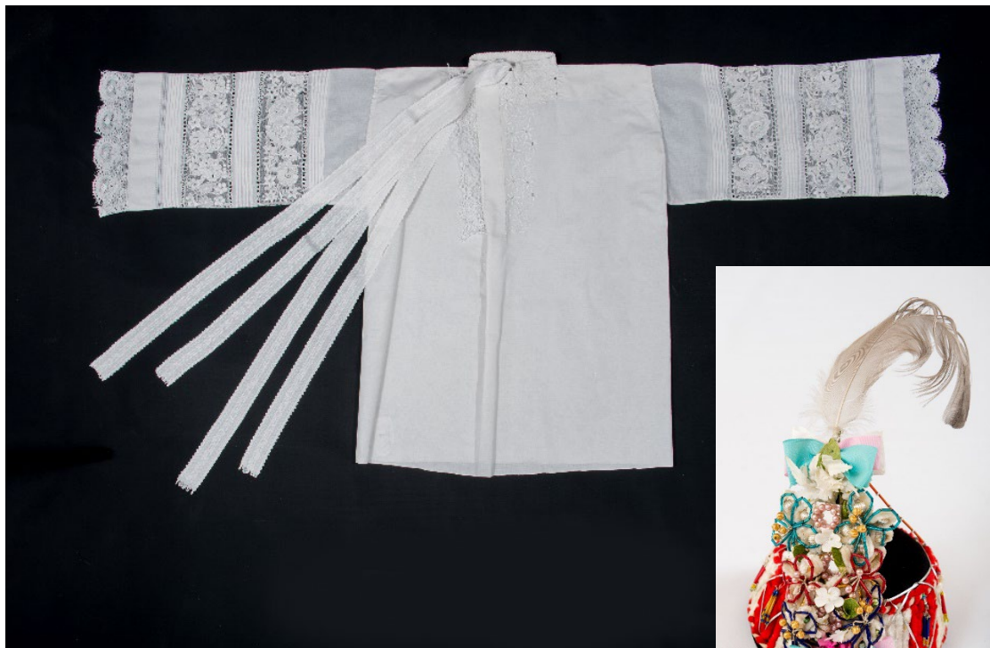
Košile, klobouk a vesta