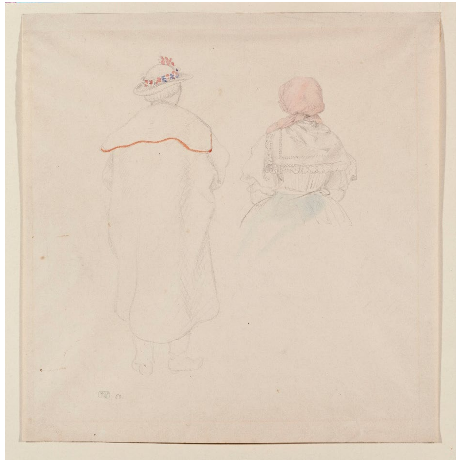
Mládenec ze Staré Břeclavi, J. Mánes, 1856.