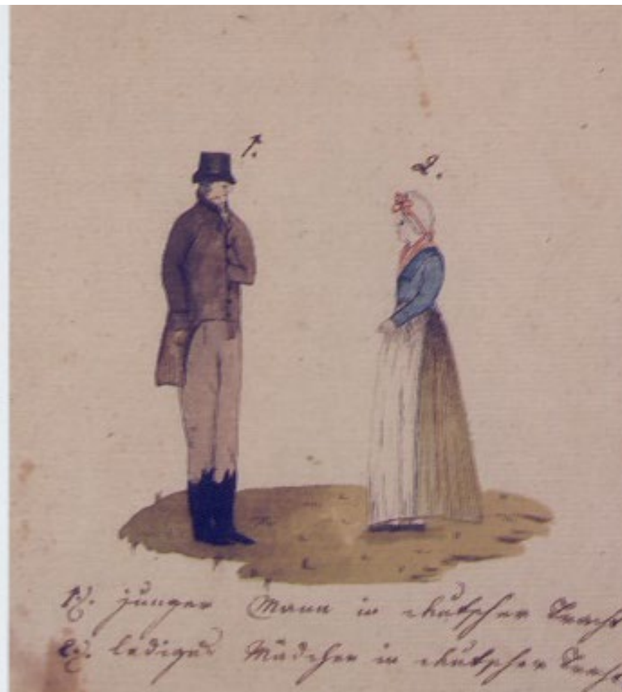
Mládenec a dívka ve venkovském a městském oděvu, Kvaše 1814