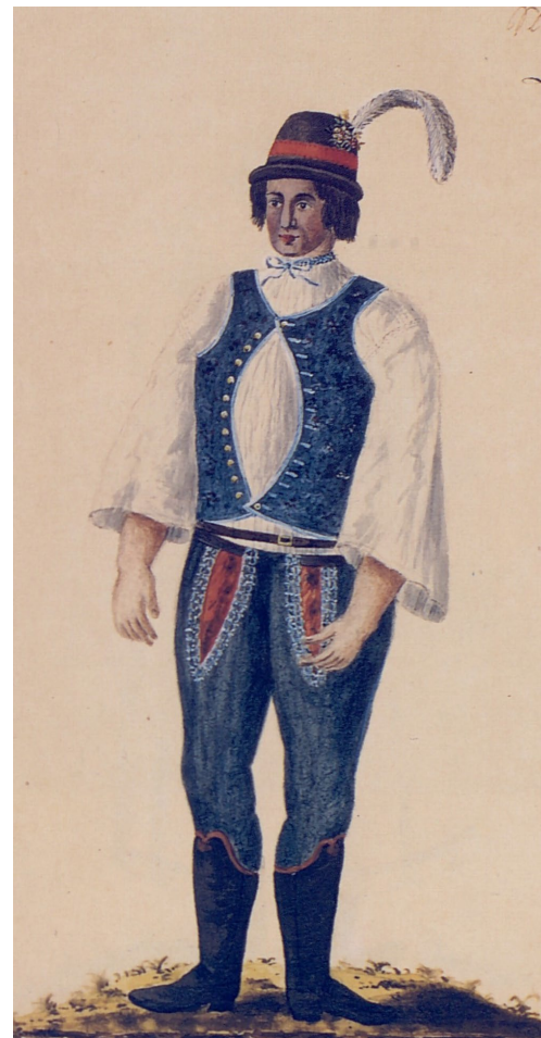
Dívka a mládenec z Břeclavského panství, Kvaše 1814