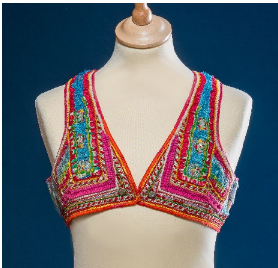
Vesta a sukně