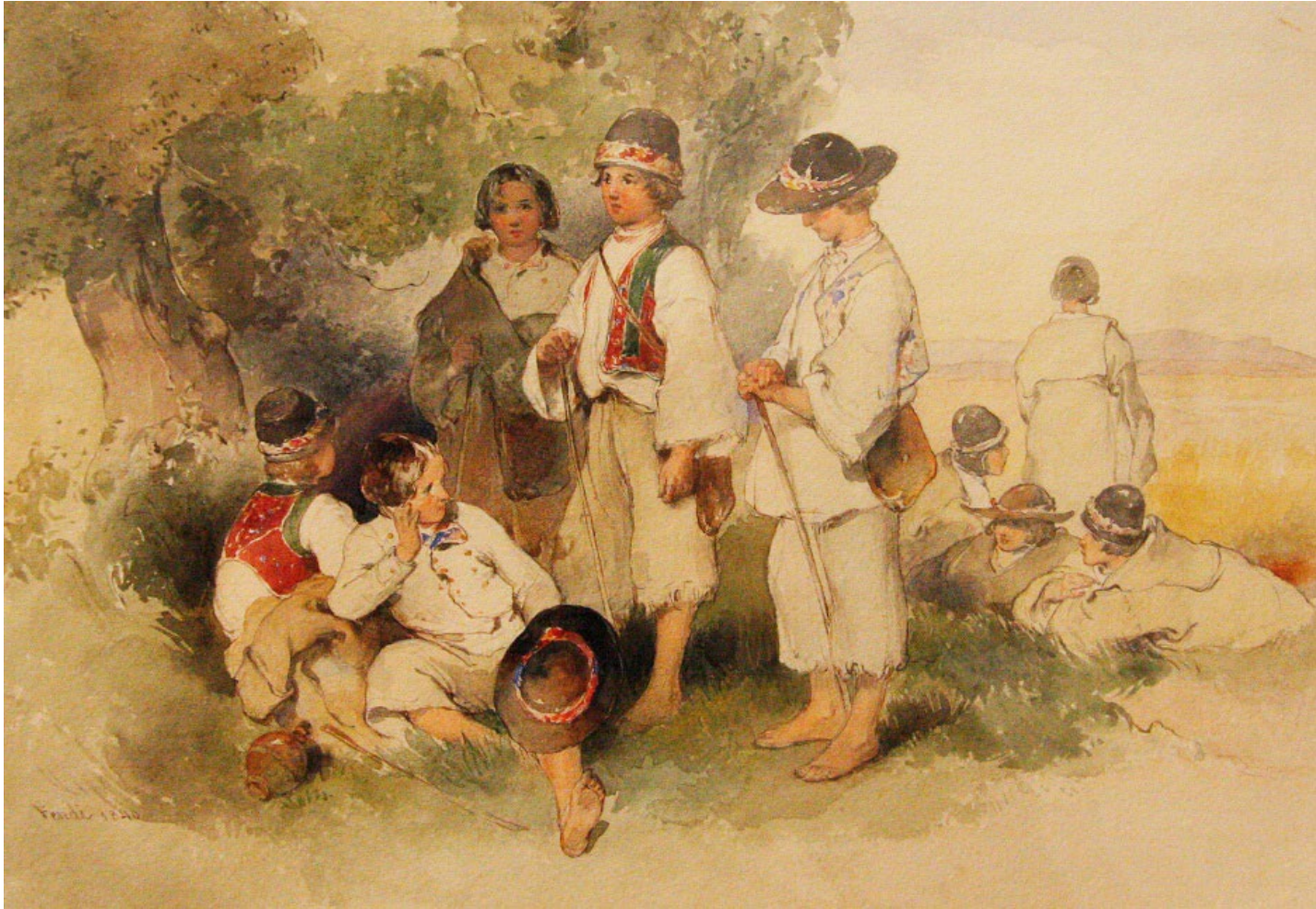
Děti z Moravské Nové Vsi. P. Fendi, cca 1840