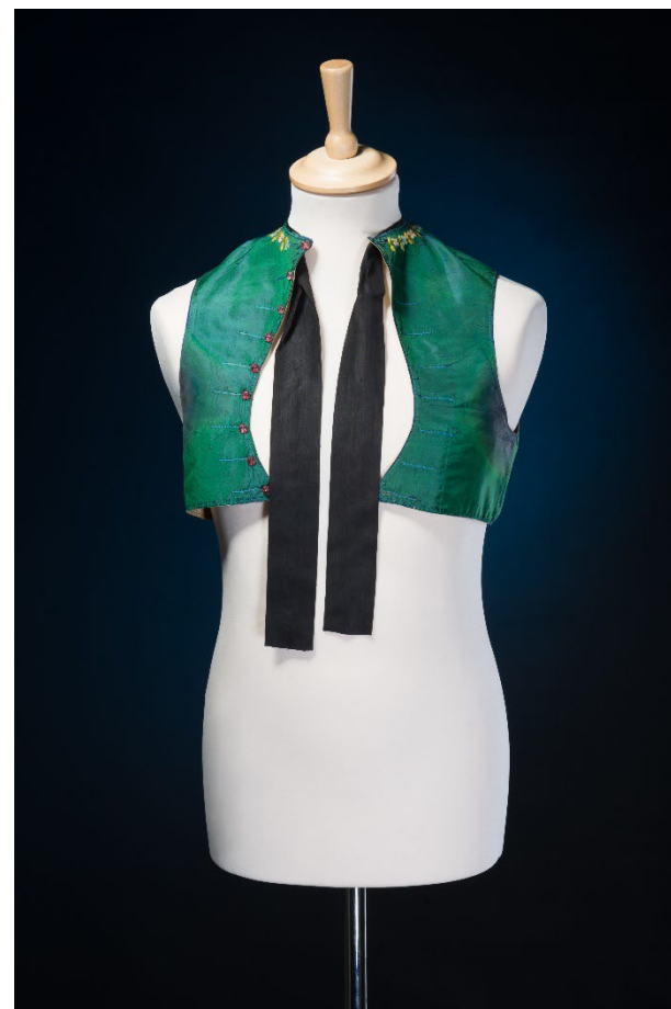
Košile, šátek a vesta