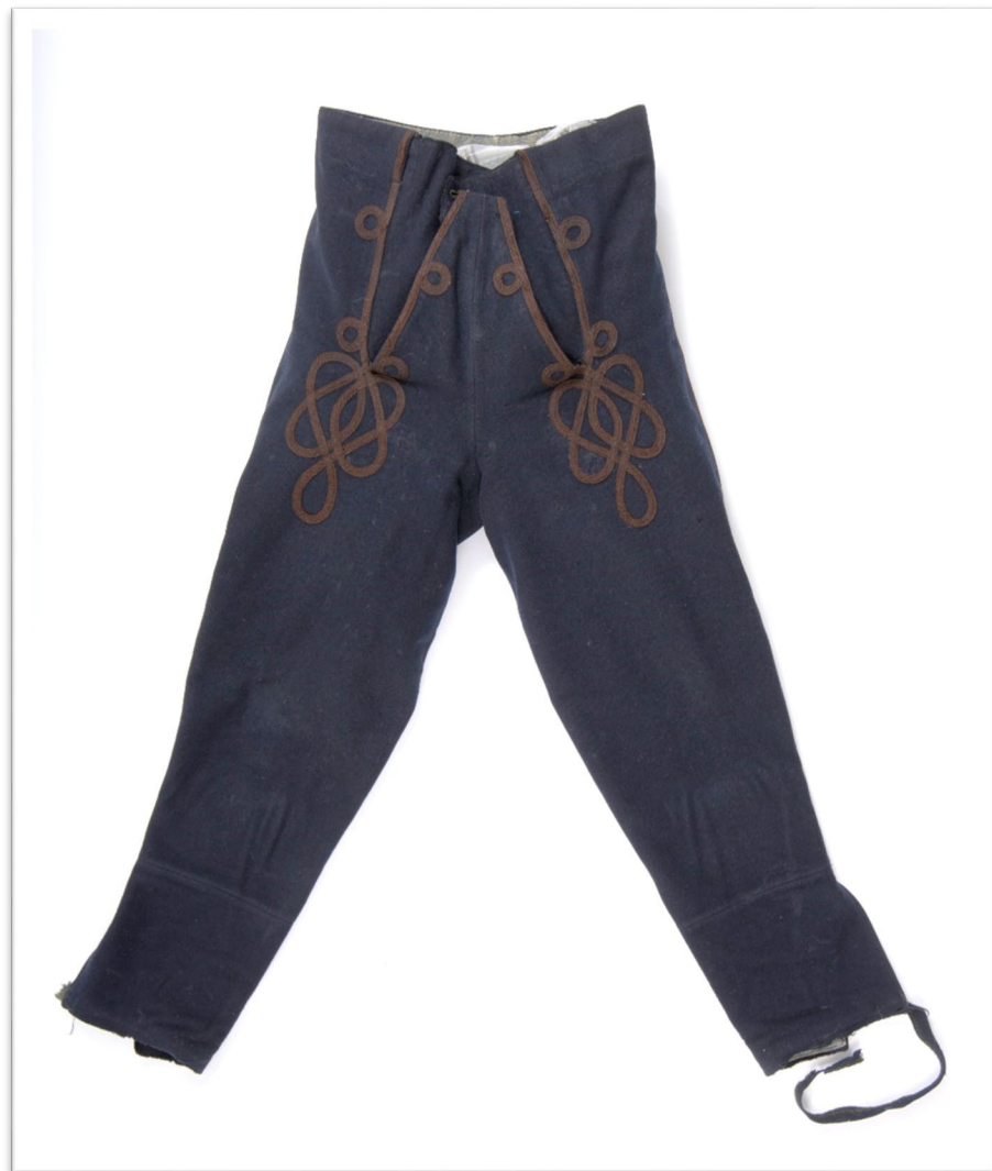
Klobouk, holínky a kalhoty