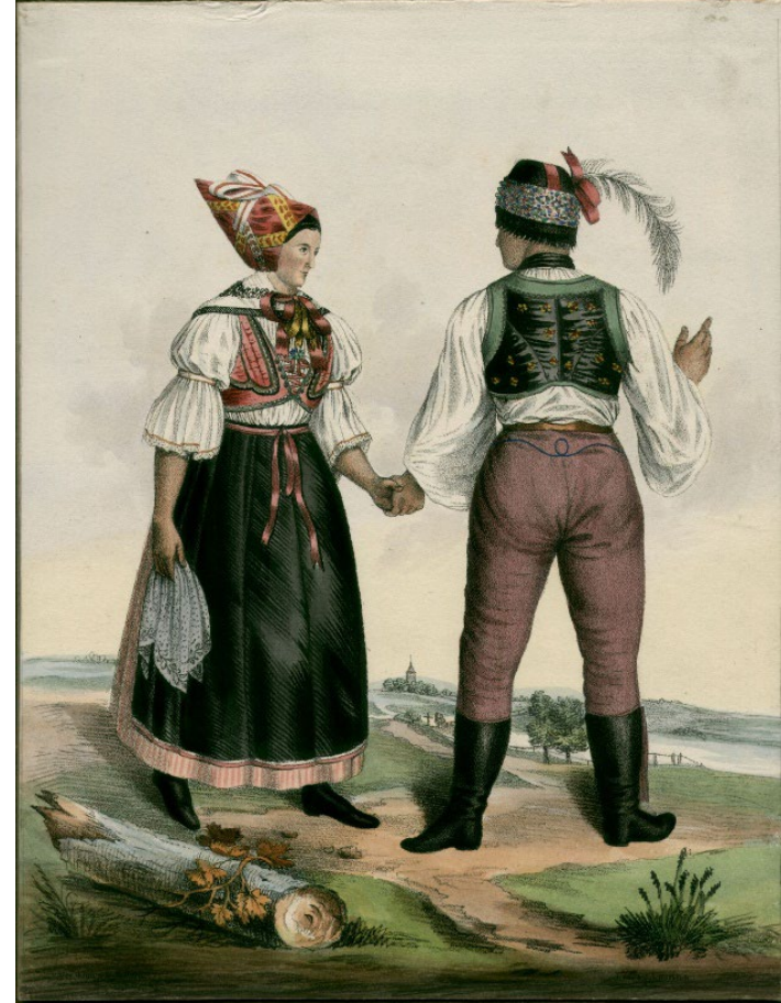
Obyvatelé břeclavského panství, W. Horn, 1837