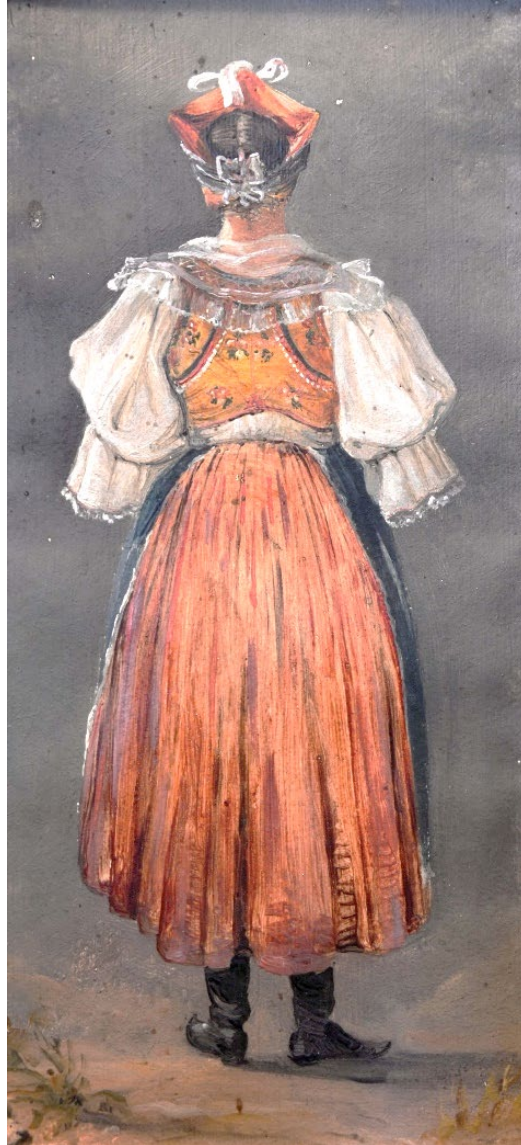
Dívka ve Svátečním kroji, Autor neznámý, cca 1840