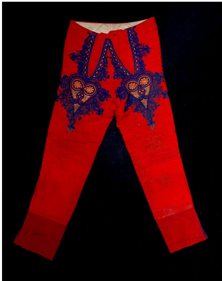
Kalhoty, šátek a holínky