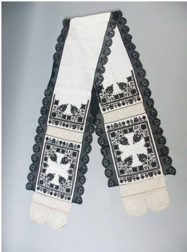
Košile, vyšíváný límec a šatka