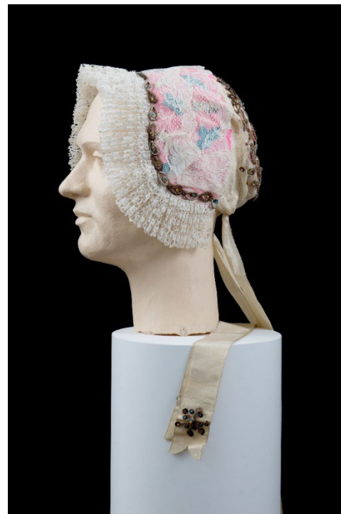
Košile, zástěra a čep