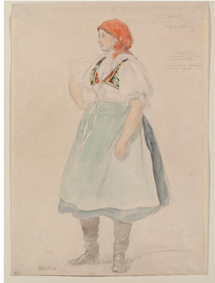
Ženy ze Staré Břeclavi, J. Mánes, 1856