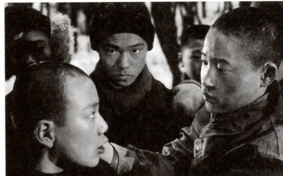
POHRANIČNÍ PÁSMO (r. Park Chan-wook) NÁŠ POKRIVENÝ HRDINA (r. Park Chong-won)