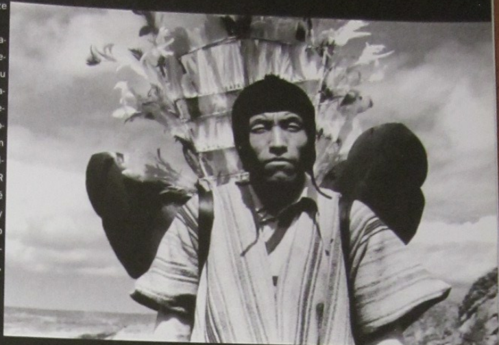
La nación clandestina

MALLKU, kdy v jedné chvíli filmařům rovněž hrozil útok ze strany špatně informovaných vesničanů. Komédie Pro ptáčí zpěv, kde epizodní roli Francouzky usazené v Andách vytvořila dokonce mezinárodní hvězda Geraldine Chaplinová, odpovídá současnému nerevolučnímu času Latinské Ameriky. „Pád berlínské zdi a rozpad socialismu ve východoevropských zemích ochromil latinskoamerickou levicu,“ lituje Sanjinés. „Neoliberalní teze tzv. divokého kapitalismu, že trh se stane univerzálním prostředkem na všechno, má na levicu demobilizující účinek... Nezdár prvního nárazu kapitalismu v bývalém SSSR nás však nutí socialistický model znovu promyslet a jisté věci řešit nově, zvláště důležitost individuální svobody a hodnotu osobní iniciativy. Podle mého mínění bude po těchto událostech trvat velmi dlouho, než vznikne nová, lidštější a spravedlivější civilizace. Není divu, že jsme nyní, v bouři konjunktury, dezorientováni.“