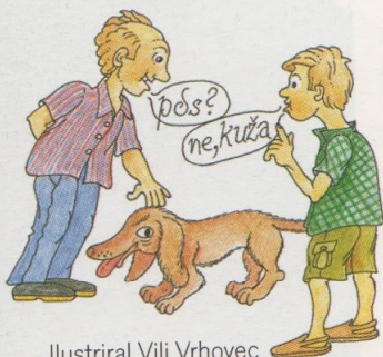
Ilustriral Vili Vrhovec