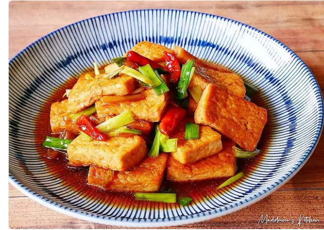
紅燒豆腐 Hung4 siu1 dau6 fu6