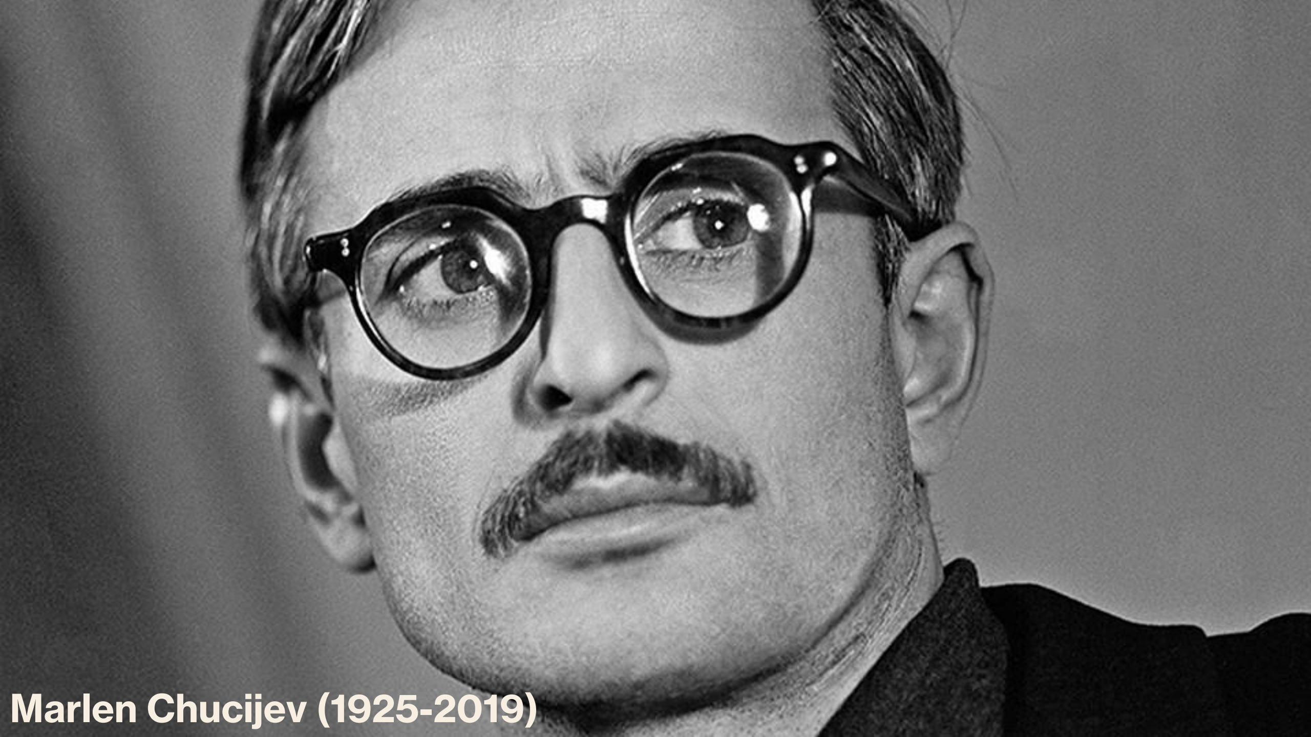
Marlen Chucijev (1925-2019)