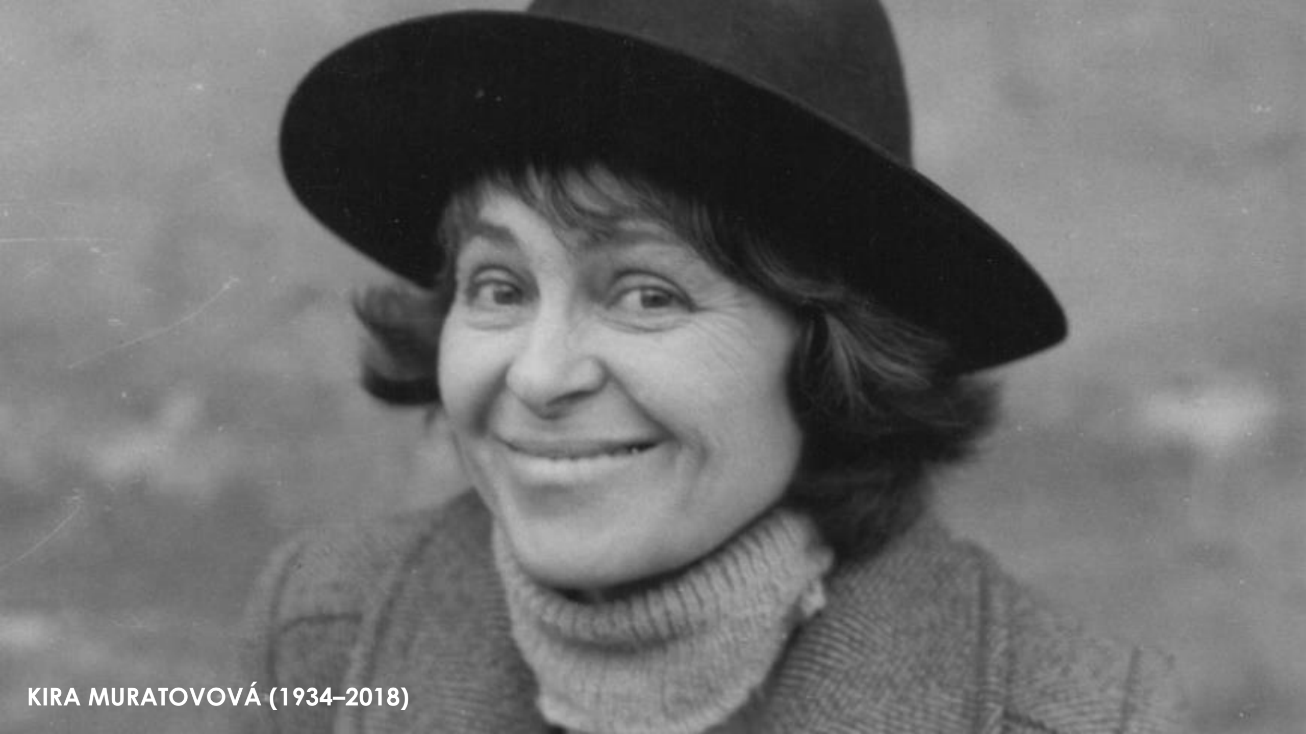
KIRA MURATOVOVÁ (1934–2018)