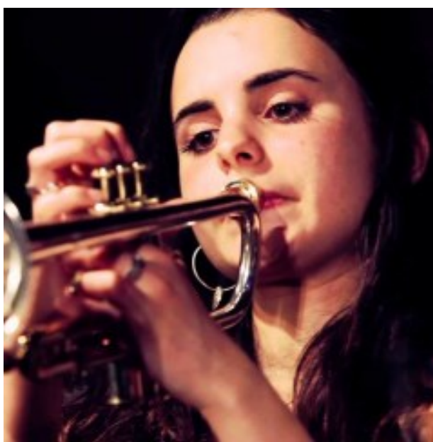
Andrea Motis (*1995)