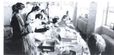
příprava materiálů pro tvorbu

Co všechno je nutné před samotnou lekcí promyslet a připravit? Existuje univerzální model přípravy na lekci výtvarné výchovy? Na jaké fáze lekce je třeba klást hlavní důraz a proč?