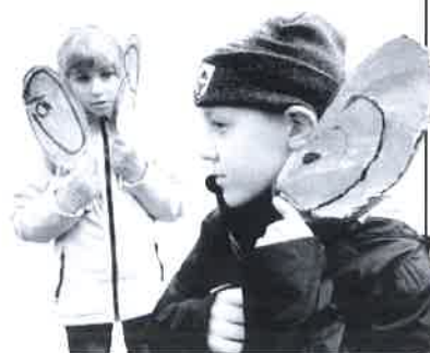
Les uší slyší, žáci 1. st. ZŠ

Promyšlíme možnosti včlenění průřezových témat, práce s mezipředmětovými vztahy a s širšími kulturními kontexty.