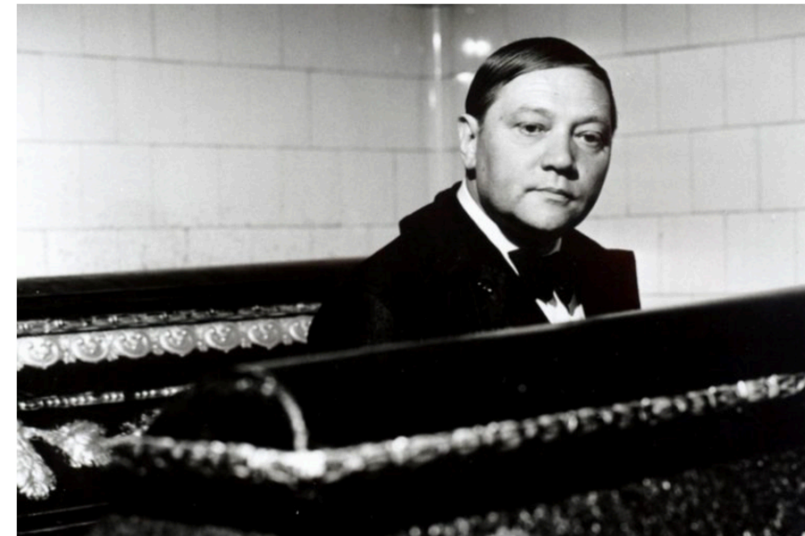
The Cremator

Dříve jsme se ohlédli za českými pokusy o žánr definovaný spojením zpěvu, tance a dramatu (muzikál) a za zdejšími příspěvky k žánru identifikovatelnému díky výpravě, nadpřirozeným prvkům nebo využití archetypů (pohádky). Tentokrát nás bude zajímat žánr zpravidla vymezovaný podle kognitivní reakce, kterou vyvolává u diváků – horor. Jak se dočteme v publikaci Film a filmová technika , emoce, jež provázejí sledování hororů, mají biologický základ a v zásadě se jedná o strach ze smrti, jejíž předzvěstí je zpravidla nebezpečná a nelidská bytost, hororové monstrum. [2]