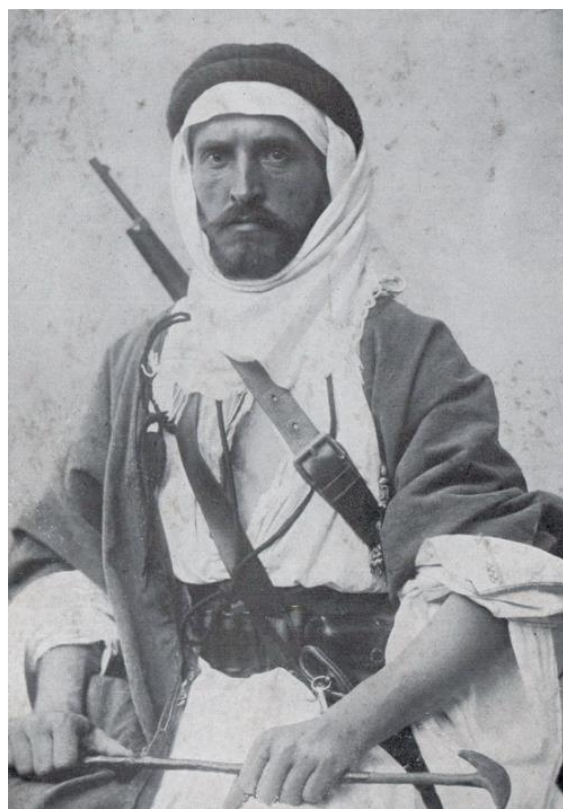
Alois Musil , 1901.

Alois Musil: Ze světa islámu . Ed. Pavel Žďárský. Akropolis, Praha 2014, s. 90–91.