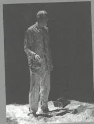
S kůží na trh

PERFORMER jedná sám za sebe, ze sebe tvoří a představuje svoji vlastní roli, v dané situaci nese kůži na trh, bezprostředně se angažuje i v sociálních vztazích a za své jednání je plně sám zodpovědný. Přímou zasahuje do reality dění (v skutku uskutečňuje skutečnost), nepotřebuje vytvářet iluze, popisovat, vyprávět příběhy, ale reálnou akci modeluje situace a děje