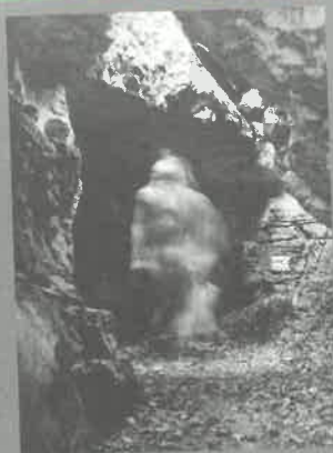
Být či nebyt