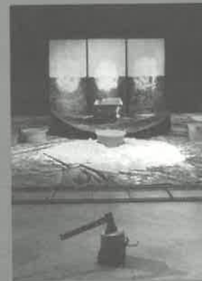
Ve třech dnech