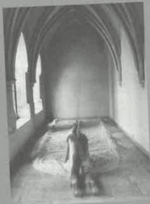
Prášení na konci chodby