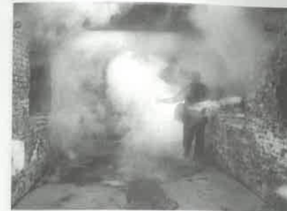
Rtuť a sira