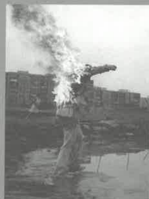
8 8 88

Volné umění akce zahrnuje široké spektrum živé práce s informacemi, zabývá se uměním interakce, medializace a prezentace.