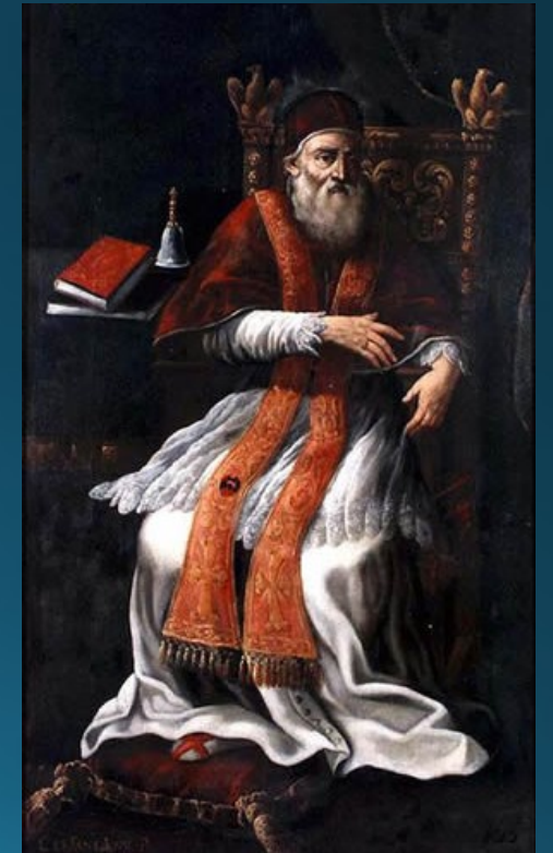
Pavol IV. (1555 – 1559)