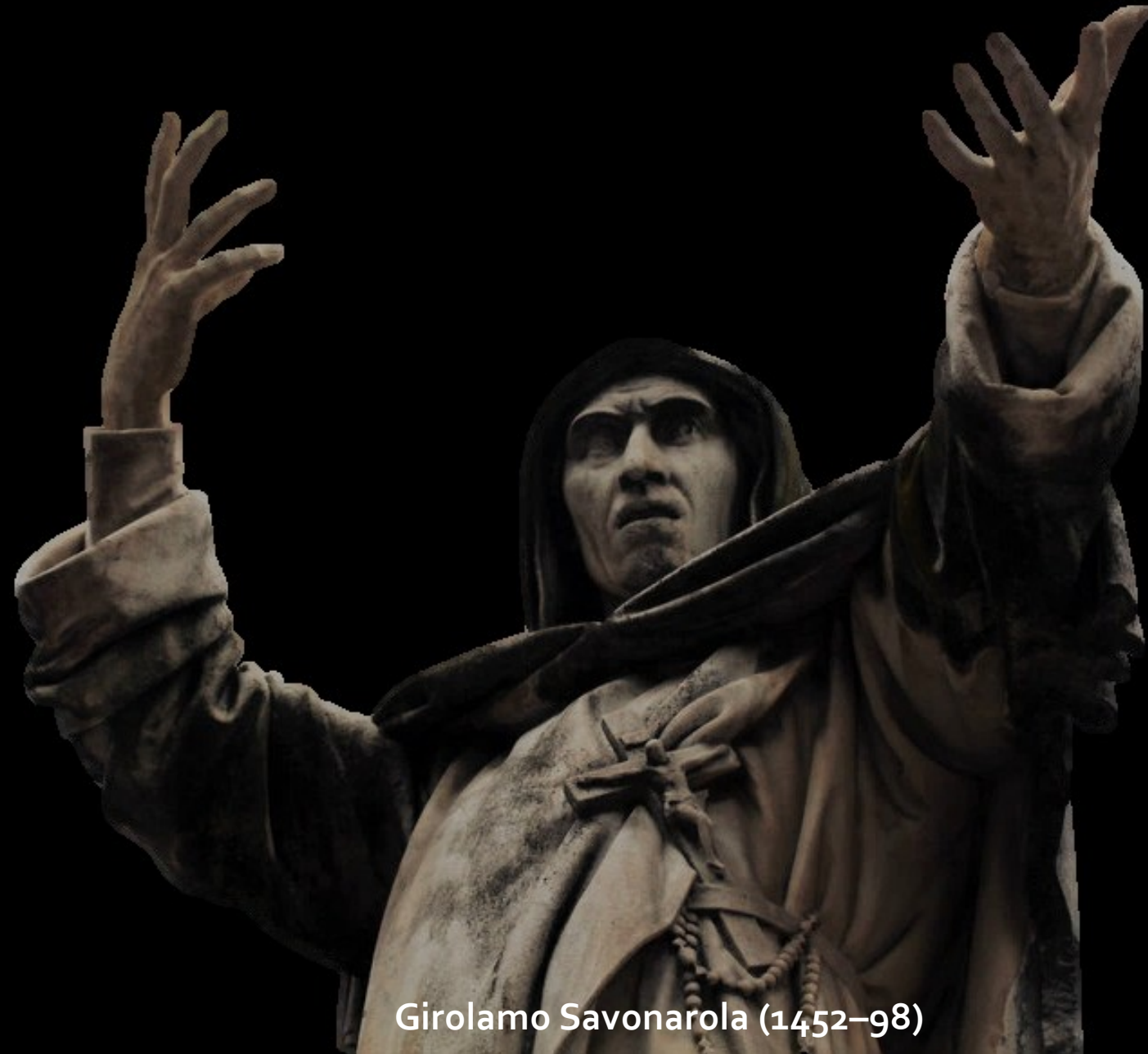
Girolamo Savonarola (1452–98)