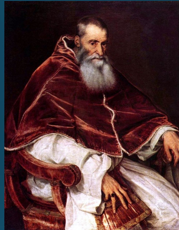
Pavol III. (1534 – 1549)