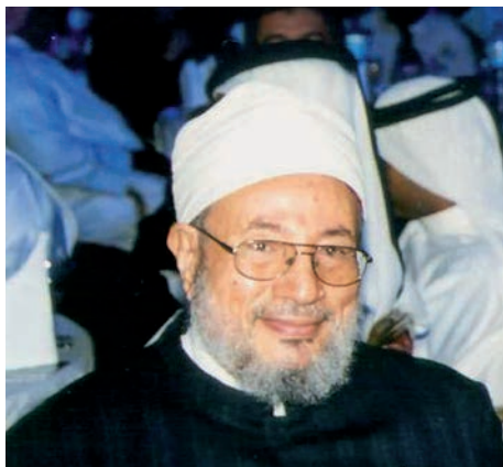
Šejch Júsuf al-Qaradáwí

Důvodů pro tuto erozi by se jistě našlo více, zde připomeňme jen dva z nich: Předně spojením se světskou mocí, včetně různých autoritářských režimů, se mnozí