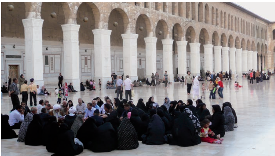
Šiitské iránské poutnice na nádvoří Velké umajjovské mešity v Damašku