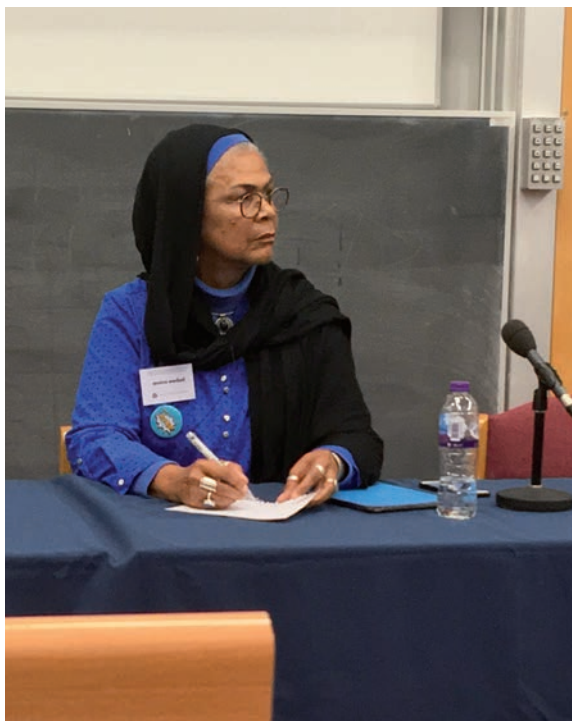
Amina Wadud, přední představitelka muslimského feminismu

Netřeba rozvádět, že úvahy současných muslimských intelektuálů o univerzálních hodnotách, islámu v dnešním globalizujícím se světě atp. při pohledu zvnějška bohužel zpravidla zanikají v kakofonii hlasů, proti nimž se obracejí – tedy v rétorice fundamentalistů a radikálů. To by ovšem nikterak nemělo snižovat jejich význam.