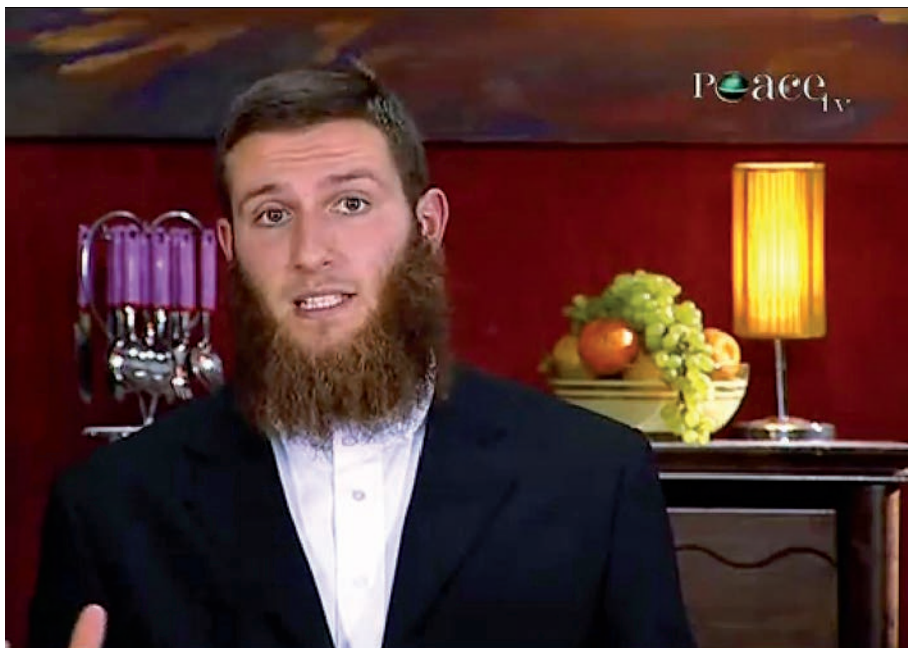
Musa Cerantonio, australský radikální kazatel zatčený pro podporu IS