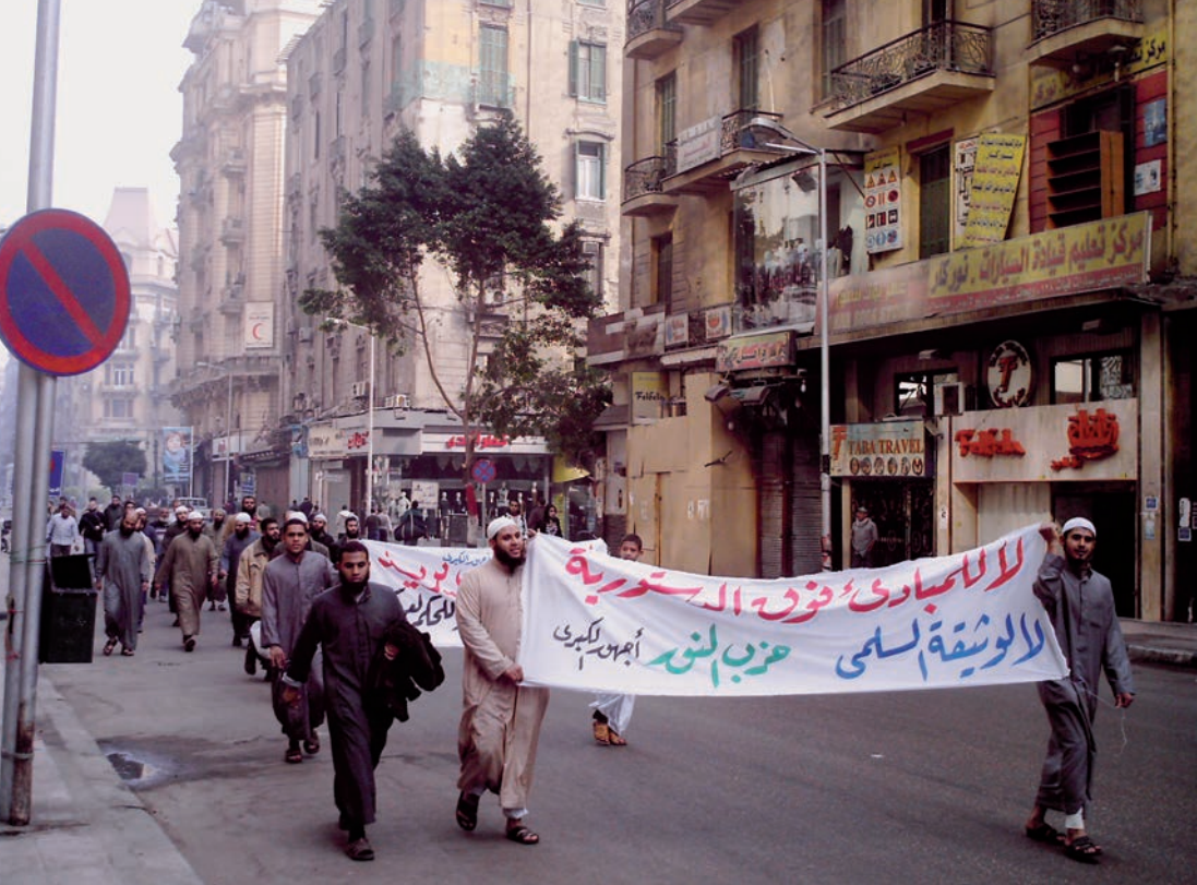
Výjev ze salafistické demonstrace