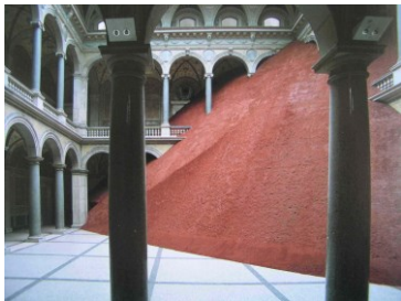
Magdalena Jetelová Domestikace pyramidy, 1992 Muzeum užitého umění, Vídeň 2009