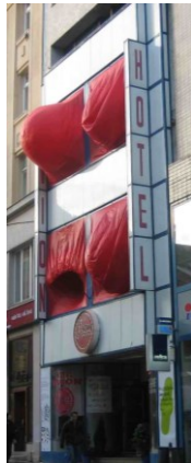
Dýchající dům Brno Art Open