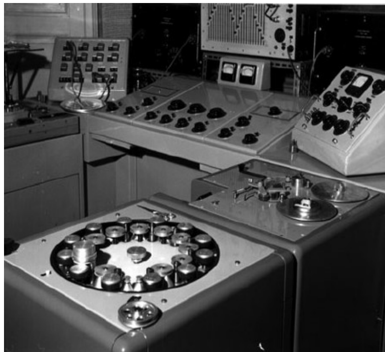
obr., vybavení studia GRM v roce 1953, na pravé straně dva typy Phonogenu, zdroj: TERUGGI, 2007, s.213-231, s. 216.