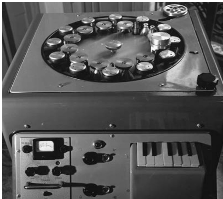
obr., Phonogene