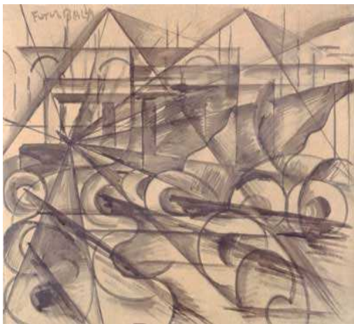
Giacomo Balla: Automobil v pohybu

Z italských futuristů dále stojí za zmínku Giacomo Balla (1871 – 1958), který se zajímal také o uměleckou fotografii a litografii. V jeho malbách i kresbách je mírně znatelný kubistický vliv: