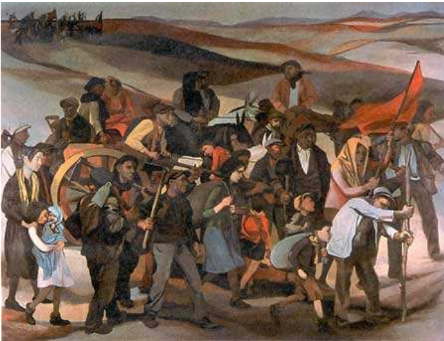
Renato Guttuso: Zabírání neobdělané půdy na Sicílii

Umění po 2. světové válce se snaží evokovat válečná témata a reagovat na aktuální politické a sociální události. Mezi nejvýznamější malíře zde patří jednoznačně Renato Guttuso