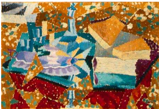
Gino Severini: Les voix de ma chambre (Hlasy mého pokoje)

Obraz italského futurismu by nebyl úplný beze jména Gino Severiniho (1883 – 1966), který však většinu svého života prožil v Paříži a byl proto ovlivněn spíše uměleckým prostředím Montparnassu.