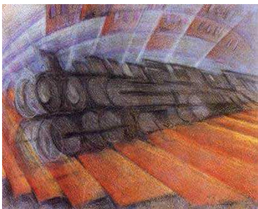
Luigi Russolo: Dynamismus vlaku

Zajímavou osobností futurismu je Luigi Russolo (1885 – 1947), přítel Boccioniho a Marinettiho, který se kromě malby vášnivě oddává hudbě. Tvrdí, že „hluk“ je jediný prvek umožňující vskutku moderní hudbu ve shodě s futuristickými zásadami, proto publikuje manifest „L'Arte dei rumori“ (Umění hluku).