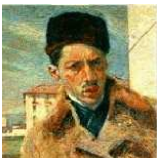
Umberto Boccioni: Autoportrét

Nejvýraznějším malířem tohoto stylu byl bezesporu Umberto Boccioni (1882 – 1916), který byl velmi talentovaný nejen v malbě, ale i v oblasti sochařství, bohužel zahynul ve velmi raném věku pádem z koně.