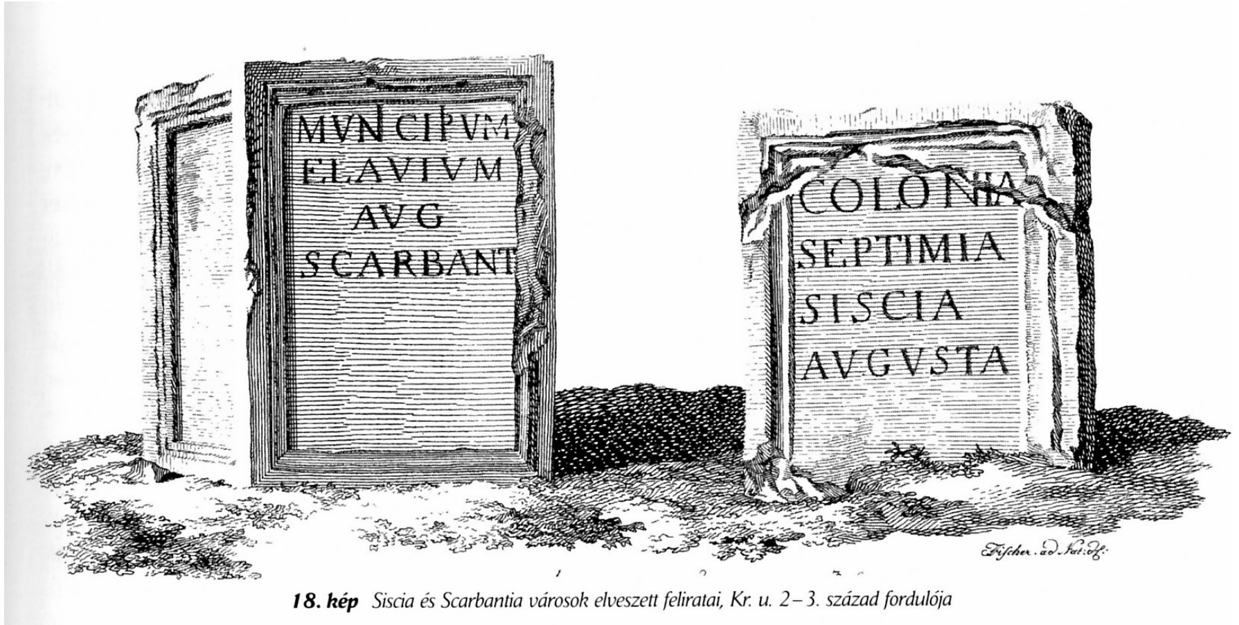
18. kép Siscia és Scarbantia városok elveszett feliratai, Kr. u. 2–3. század fordulója